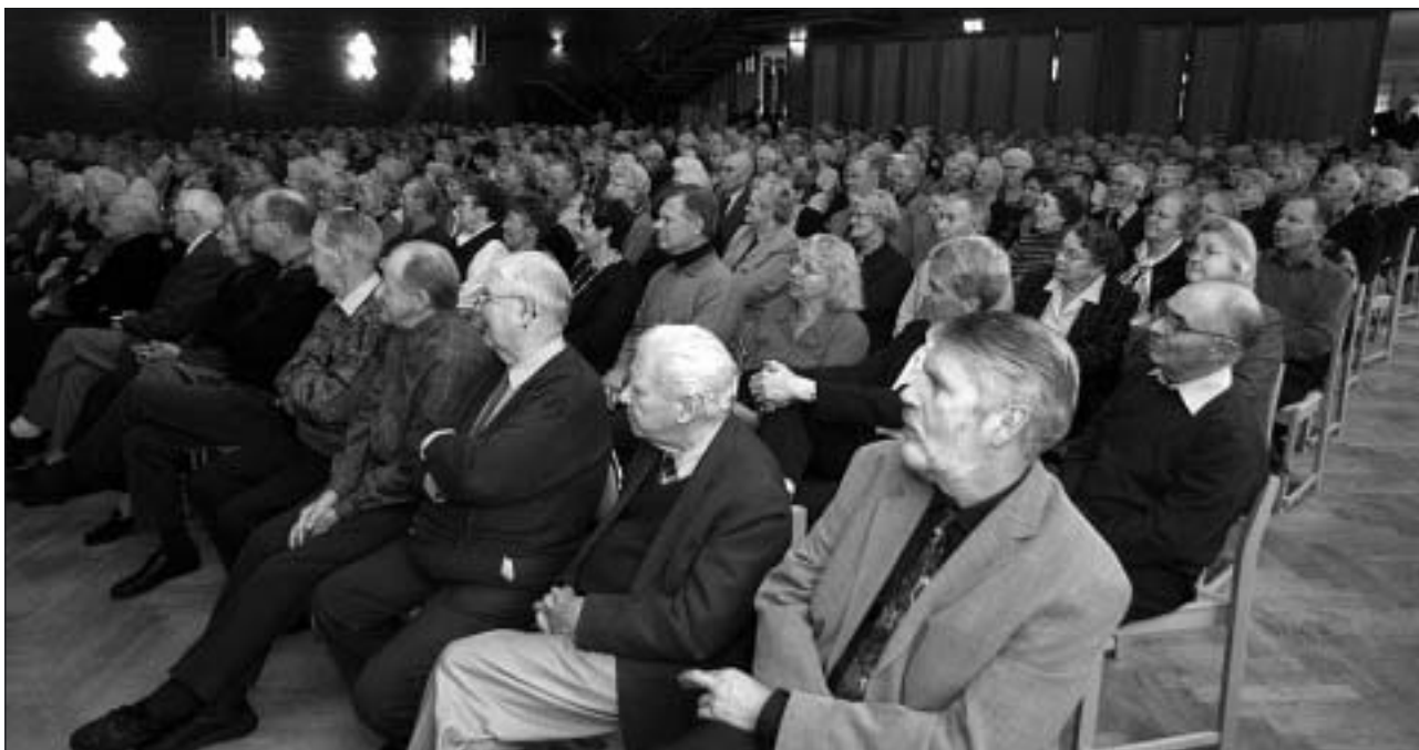
Fullsatt till sista stolen i A-salen.

Den 10 november ägde den numera traditionella Pensionärsdagen rum på f.d. Folkets Hus. Som vanligt var det Karlskoga kommun som stod bakom arrangemanget tillsammans med samtliga pensionärsorganisationer.