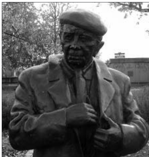
Ivar Lo-Johansson står staty vid sin minnessten i Tungelsta.