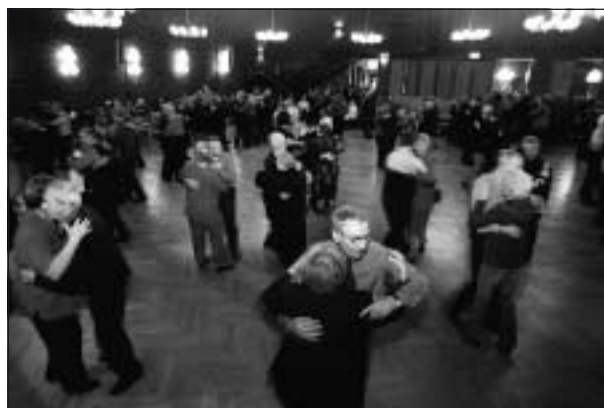
Full fart på dansgolvet.