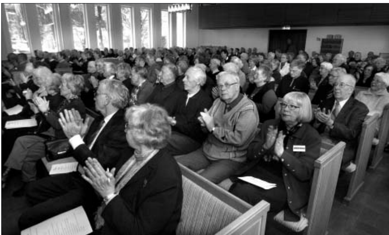
Cirka 230 medlemmar deltog i årsmötet.

Sveriges Pensionärsförbund - Seniororganisationen i tiden Karlskogaföreningen