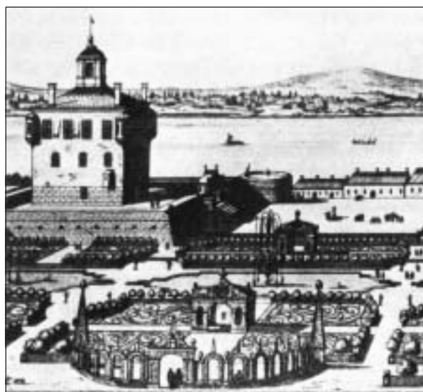
Örbyhus slott där den beryktade ärtsoppa tillredes.

Avsättningen lyckades och Erik hölls i fängsligt förvar till sin död. Fångvaktarna instruerades att om någon skulle göra fritagningsförsök av konungen skulle dessa antingen kväva honom med hans madrasser eller ge honom gift. Från början var det sagt att de skulle tillreda honom en dryck ”aff opium eller mercurium (kvicksilver) så stark att han öfver någre thimmer icke kan leffve”. Men som bekant blev det istället arsenik som ändade konungens liv den 26 februari år 1577.