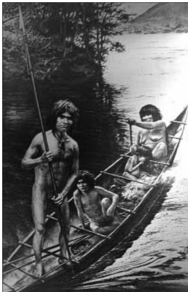
Fotot är taget på museet i Puerto Williams av teckningar gjorda av den tecknare som upptäcktsresanden Robert Fitz Roy hade med sig på sin andra resa med fartyget H.M.S. Beagle. Med på samma resa var också Charles Darwin.

de jagade men också fåglar, vilda frukter, bär och svampar och då de vistades nära havet åt de naturligtvis skaldjur. 1881 då den moderna kolonisationen av Eldslandet började var antalet Shelknam ca 4000 men under endast ett fåtal årtionden försvann de helt.