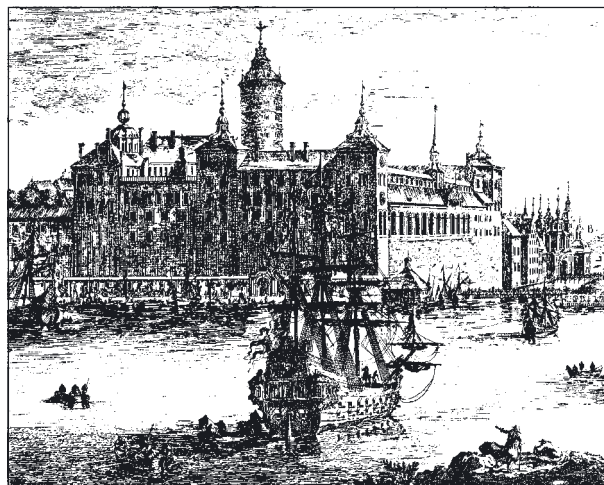
Slottet Tre kronor enligt Eric Dahlbergh i hans praktverk "Suecia antiqua et hodierna" (Gamla och Nya Sverige) från 1600-talet.

När mörkret sänkte sig över staden var slottet ödelagt. Endast delar av norra längan stod kvar.