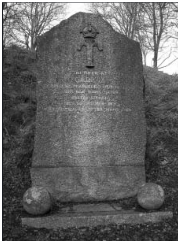
Minnesmärket över stadens grundare Carl IX vid Tingshusparken.

K A Nilsson var sedan med om att hugga ut stenen ur ett stort granitblock i norra Granbergsdal och att utforma de två stenkloten och grundplattan efter beställarens önskemål. Stenarna som väger drygt 15 ton fraktades först med tåg från