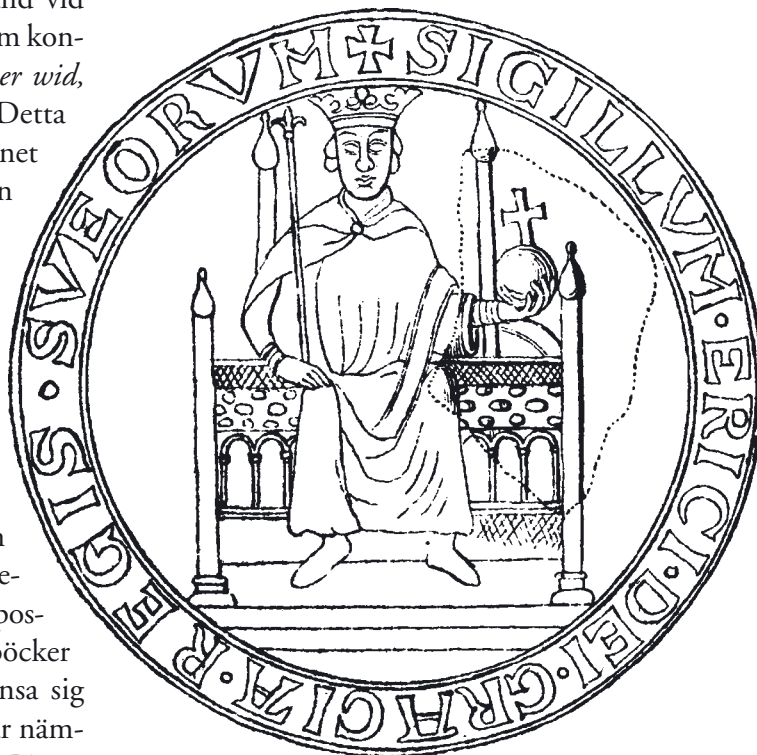
Konung Erik Erikssons rikssigill.

sonen Valdemar till kung och konfirmerat detta som seden bjöd vid Mora stenar intill Uppsala. Birger Jarl blev mäktig vred men förstod att om han inte gav sitt bifall skulle kungamöjligheten gå familjen ur händerna. Han svalde därför förtretet och ordnade istället en praktfull kröning i Linköpings domkyrka. Därmed kom en ny ätt på tronen, den s.k. folkungaätten . Historiker idag menar dock att det ingalunda var fråga om en ätt utan snarare en grupp stormän.