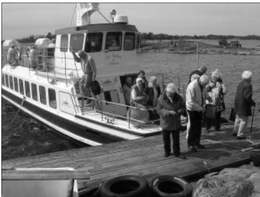
Landstigning från m/s Vinskär vid Lammskär där lunchen väntade.

Den lite märkliga tillblivelsen av kapellet skedde tack vare att visionären Hilding Bielkhammar tillsammans med sin familj och vänner 1958 började bära upp gråsten från öns stränder upp till bergets topp. Där de planerat att kapellet skulle stå. Utan några större tekniska hjälpmedel mura de sedan upp de metertjocka väggarna och bygg-