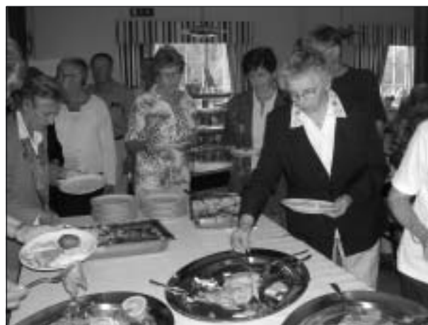
Alla lät sig väl smaka.