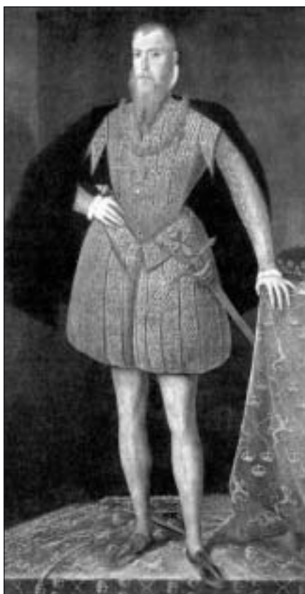
På detta magnifika sätt presenterade sig Erik XIV som friare hos drottning Elisabet I av England

Historien om Eriks engelska frieri blev alltså bara en bagatell i våra historieböcker. I dem blev Eriks namn istället knutet till Sturemorden, Karin Månsdotter, Jöran Persson och ärtsoppa, och för oss karlskोगingar även Knappforsen. Men den sistnämnda historien kan du själv ta del av på Knappforsens anslagstavla vid Lunedet!