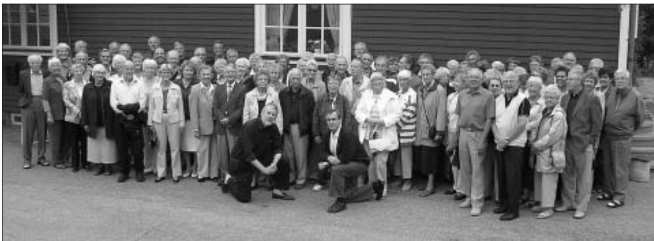
Årets funktionärsbild vid Labbsand.

Även årets upplaga av den numera traditionella Funktionärsträffen på Labbsand präglades av gott gemyt. Cirka 90 av föreningens funktionär hade hörsammat inbjudan torsdagen den 18 augusti.