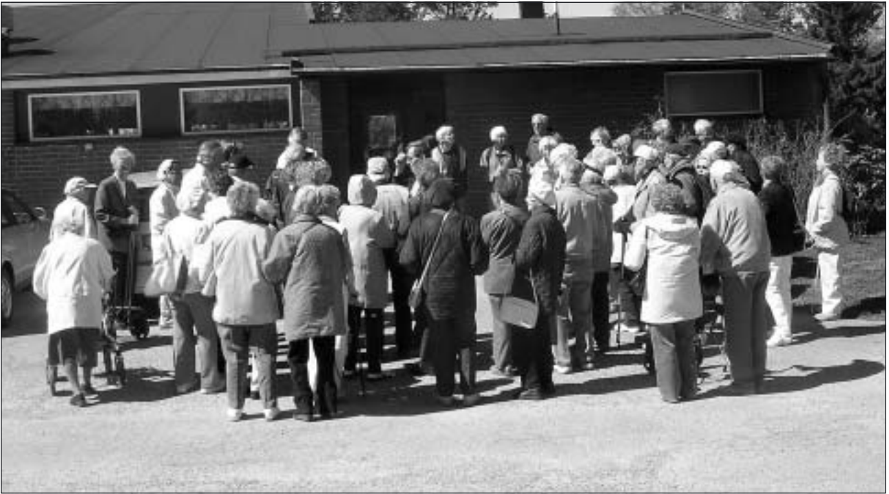
Deltagarna samlade för genomgång av dagens program.

Vädergudarna under maj månad var inte speciellt nådiga i år men den 19 maj när SPF inbjöd till den numera traditionella vårutflykten till friluftscentret i Ånnaboda var det i alla fall fullt godkänt försommarväder.