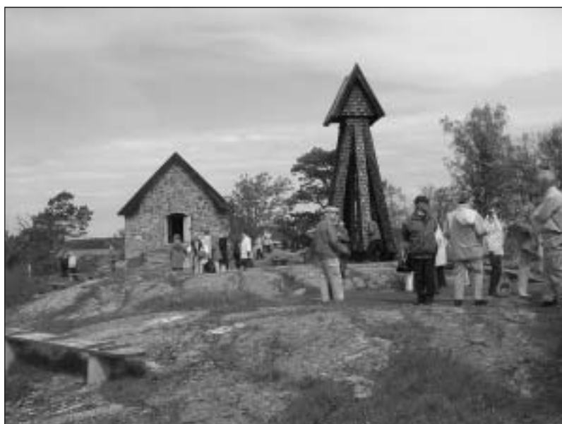
I väntan på informations- och andaktsstunden vid Capella Ecumenica.

Efter återsamling var det dags att kliva på bussen för hemfärden efter en trevlig och intressant resa. En resa som gärna rekommenderas.