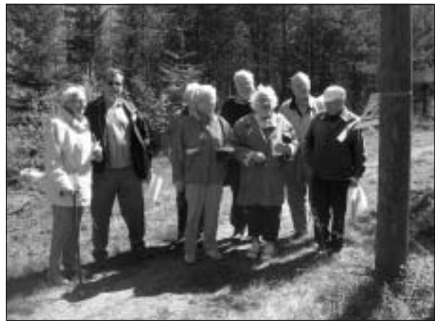
Engagerade medlemmar studerar en av de kluriga frågorna.