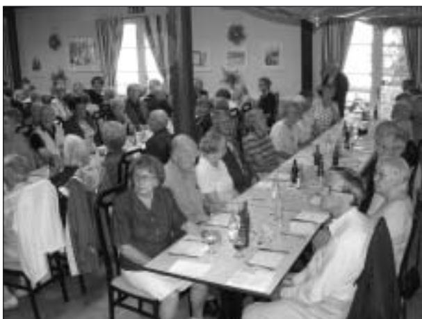
I väntan på lunch och information.