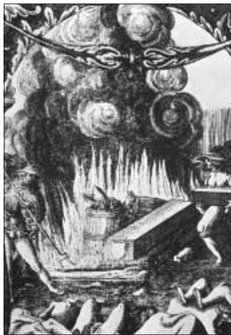
Bild från den s.k. blodbadsplanschen visande likbålet på Södermalm. I tunnorna ligger biskoparnas huvuden fortfarande med sina spetsiga biskopsmössor.

Men på den tredje dagen fängslades alla och anklagades för "kätter mot romarkyrkan". Straffet för detta var döden. Avrättningen ägde rum på Stortorget. De döda kropparna fick ligga kvar flera dagar. Sedan släpade man dem till ett stort bål på Södermalm. Kungen lät också gräva upp Sten Stures döda kropp och bränna upp den med de andra. Man beräknar att omkring 100 personer fick sätta livet till denna Allhelgonahelg. "Blodbadet" blev den händelse som definitivt gjorde slut på Kalmarunionen och dess målsättning om "en evig fred" mellan de nordiska länderna.