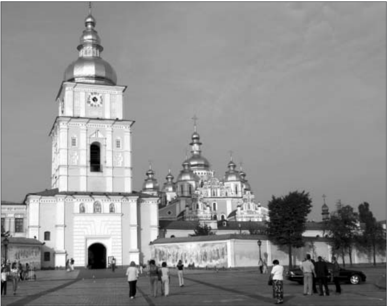
I centrala Kiev reser sig med sina guldkupoler S:t Michaels kloster, nyrenoverat men ursprungligen byggt 1108.

stora donationer och genom att arkitekter hade gjort noggranna mätningar och ritningar innan förstörelsen ägde rum. Man hann också rädda många av mosaikarbetena och målningarna och dessa förvaras idag i original på museer i Moskva och St Petersburg.