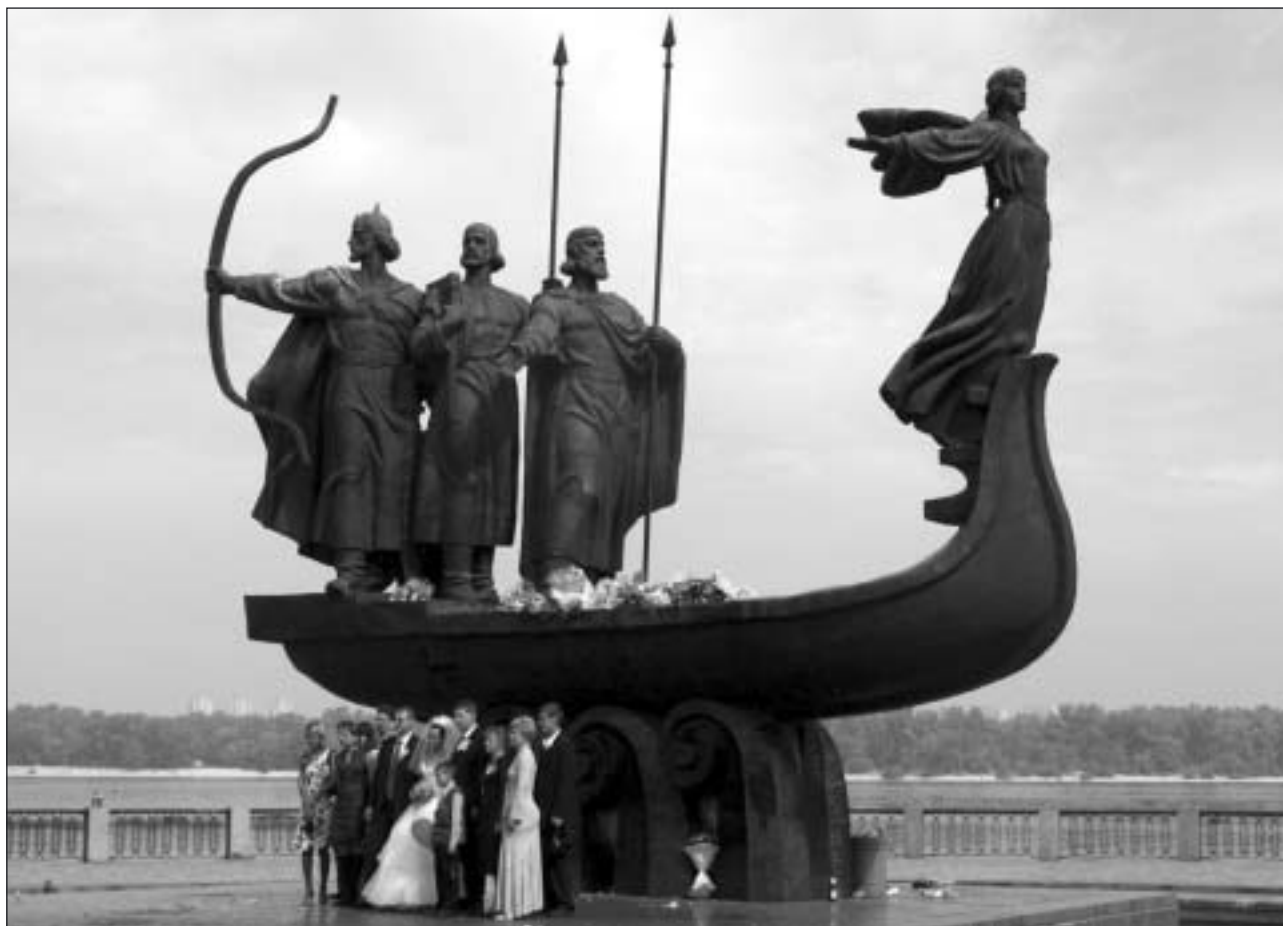
Vid Dneprs strand är statyn över Kievs grundare målet för många brudpar, som efter vigseln lägger brudbuketten där.

Vi besökte också St. Michaels kloster, som fått sitt namn efter Kievs skyddshelgon. Klostret byggdes 1108 men förstördes helt 1996 under Sovjet-tiden. Först 2001 kunde det öppnas igen i rekonstruerad form. Uppbyggnaden blev möjlig tack vare