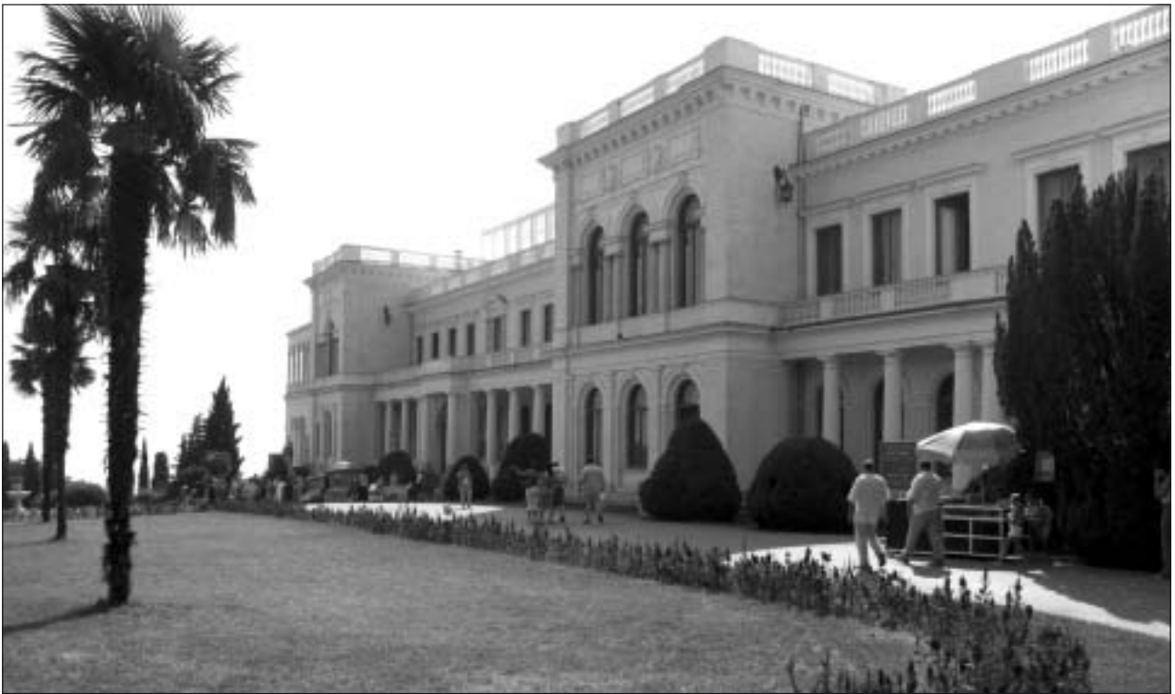
Livadiapalatsset på Krim hölls Jaltakonferensen i februari 1945 där Churchill, Roosevelt och Stalin kom överens om Europas uppdelning efter det Tyska rikets förestående fall.

Strax utanför Jalta besökte vi Livadiapalatsset, framför allt känt för Jaltakonferensen den 4 – 11 februari 1945 då Stalin, Roosevelt och Churchill träffades för att diskutera hur man skulle dela upp Europa efter andra världskrigets slut. Vi upplevde de vackra salarna där diskussionerna fördes med herrarna sittande vid det runda bordet tillsammans med sina ambassadörer och tolkar. Vi såg också det rum där det slutliga avtalet undertecknades efter en lång diskussion om i vilken ordning namnen skulle stå på dokumentet. I detta rum finns