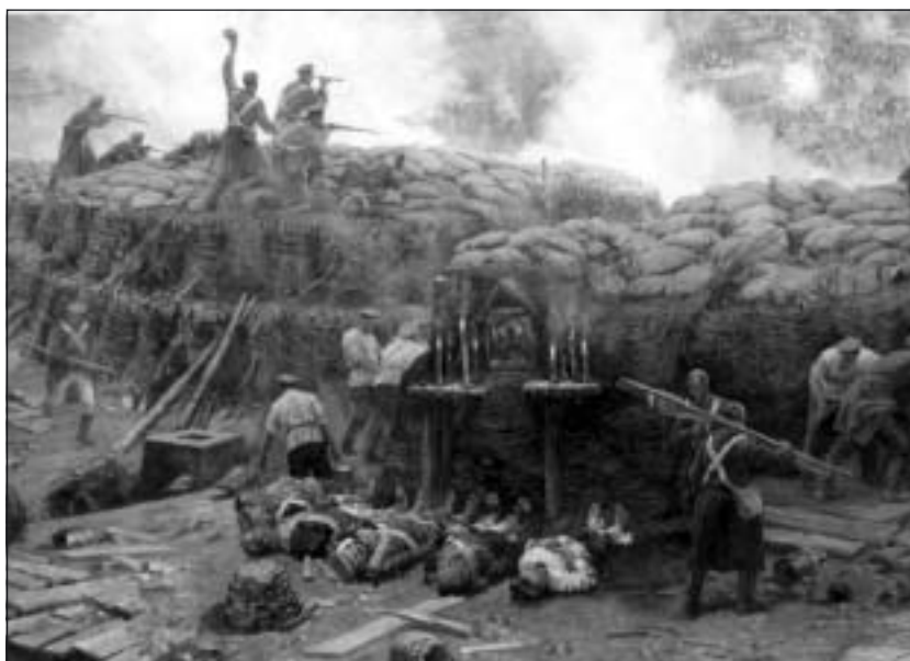
Detalj ur panoramat från Krimkriget (1854-56) i Sevastopol. Bastionen försvaras, medan sårade soldater samlas upp framför en ikon. Hela panoramat är 114 meter långt runt väggen i en cirkulär byggnad.

Utanför museet finns bl.a. en minnestavla över den berömde ryske författaren Leo Tolstoj, som deltog i kriget som 27-åring. Litteraturforskare anser, att eftersom han deltagit aktivt i Krimkriget kunde han sedan skriva sin berömda roman Krig och Fred.