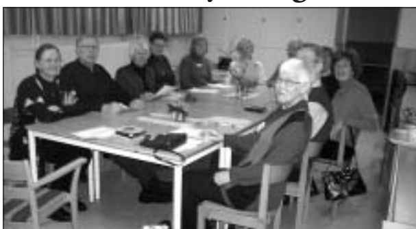
Musiklyssningscirkelns torsdagsträff, då ett 15-tal medlemmar möts på "Träffen".