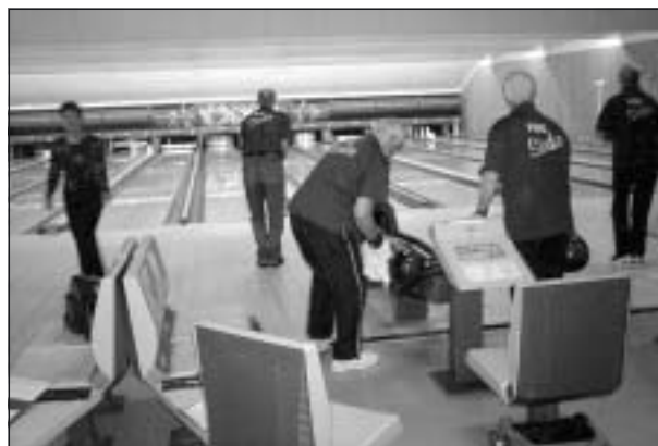
Pensionärsbowlingklubben Strike i aktion.

Många pensionärer har börjat spela bowling och blivit medlemmar i pensionärernas bowlingklubb i Karlskoga – PBK Strike. Klubben har f n ca 95 medlemmar och är därmed den största bowlingklubben i Karlskoga.