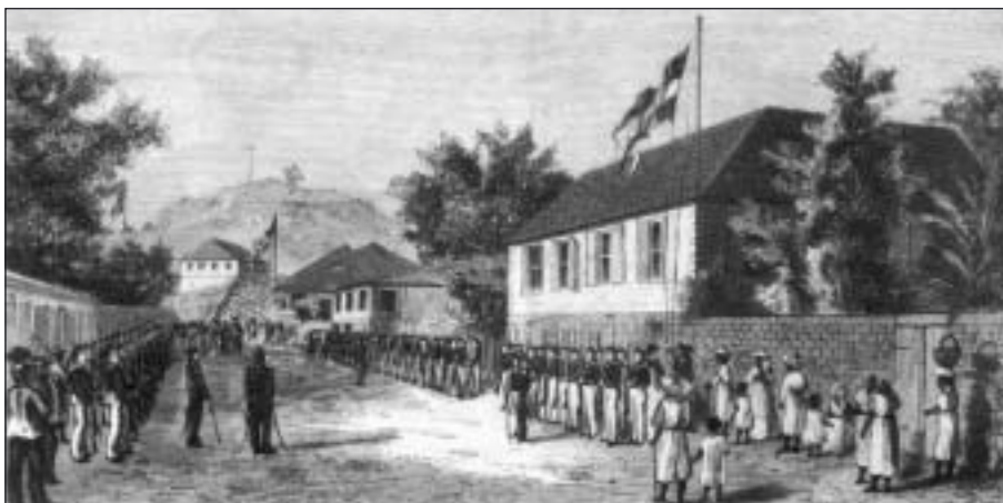
16 mars 1878: S:t Barthélemy återlämnas till Frankrike efter 94 år som svensk koloni.

Ön styrdes av en svensk guvernör och Västindiska kompaniet. Huvudorten blev Gustavia, uppkallad efter kungen. Den låg på öns västsida och hade en mycket bra och skyddad hamn. Svenska språket slog dock aldrig igenom i kolonin, men gatorna i Gustavia fick svenska namn, t.ex. Kungsgatan och Drottningegatan. Under Napoleonkrigen blomstrade ön.