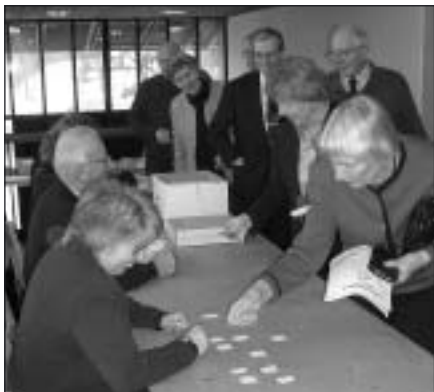
Stämningen vid entrén var god och lotterna gick fört slut.

Cirka 150 medlemmar samlades torsdagen den 2 februari i Missionskyrkans kyrksal för föreningens 28:e årsmöte. Det blev som de närmaste årens årsmöten lugnt, värdigt och enigt.