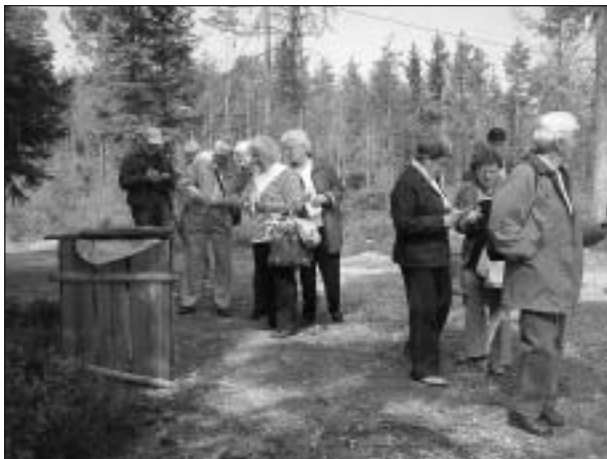
Här är det funderingar kring frågorna vid en kontroll.

Som vanligt fanns tre olika tipspromenadslingor utlagda. Två av dem var av det lite kortare slaget medan den tredje var för de något spänstigare och var på cirka 5 kilometers längd. Merparten av deltagarna visade sig tillhöra den spänstigare skaran och knallade hurtigt iväg med sina respektive tipslappar.