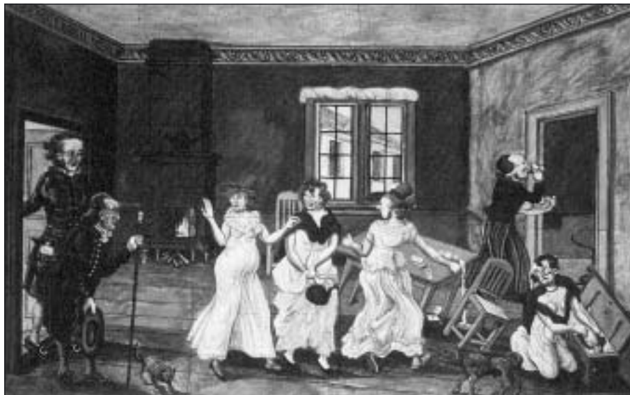
I sin kamp mot lyx och överflöd (=kaffe!) infördes på 1700-talet kaffeförbud. Bilden visar ett dramatiskt slut på ett förbjudet kafferep: polisen överraskar de kaffedrickande damerna.

Ett uppskattat bakverk i kafferepssammanhang är smörgiffeln. Dess "historia" är intressant och knuten till just september månad för 323 år sedan. Vid den tiden var det osmanska riket – gammalt namn på Turkiet – en stormakt som år 1683 vällde in i Österrike med en ofantlig här. Wien omringades snabbt. Under två svåra månader lyckades wienarna ensamma hålla stånd mot den väldiga övermakten. Inte mindre än sexton gånger försökte sultanens horder storma Wiens låga murar. Det kristna Europa upplevde angreppet med både oro och skräck. De kristna uppfattade nämligen osmanerna som vilda och grymma krigare och fanatiska anhängare av en orättfärdig religion. De beslöt att lägga sina egna konflikter åt sidan och gemensamt försöka stoppa turkarna. Följaktligen uppbyggde de undsättningsarméer som ilade österrikarna till hjälp. Den 12 september såg de belägrade på natten från Stefanstornet i Wien äntligen raketer stiga upp mot himmelen från en närbelägen höjd. Det var tecknet på att hjälpen hunnit fram. Turkarna besegrades och fred slöts senare i Karlowitz. Där förlorade det osmanska