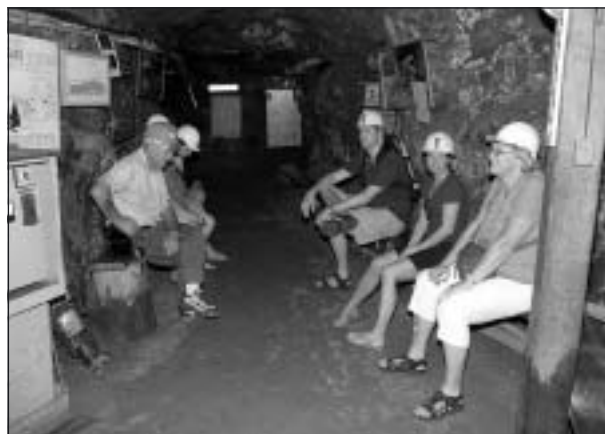
På besök i guldgruva guidade av en erfaren gruvarbetare.

1898 påbörjades byggandet av den pipeline, som vi följt under vår färd till Kalgoorlie. Problemet att föra vattnet från Mount Helen till guldfälten var inte bara avståndet utan också nivåskillnaden på 400 meter. För att lösa det problemet pumpades vattnet upp i inalles åtta dammar under sin färd. Idag är det inte bara Kalgoorlie som får vatten utan längs hela de nära 60 milen har många samhällen vuxit upp. Det tar två veckor för vatt-