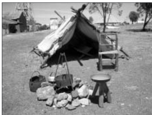
Guldgrävarens primitiva förhållanden. De bodde mestadels i tält eller plåtskjul, som de snabbt kunde flytta med sig.

Livet på guldfälten var mycket hårt. Kalgoorlie ligger mitt i en öken och grundvattnet är nio gånger saltare än havsvattnet. Försök att destillera det misslyckades och för att kunna försörja den växande befolkningen med vatten och andra förnödenheter använde man sig av hästar och kameler, som fraktade detta de ca 19 milen från staden Southern Cross. Man påstår idag att huvudgatan