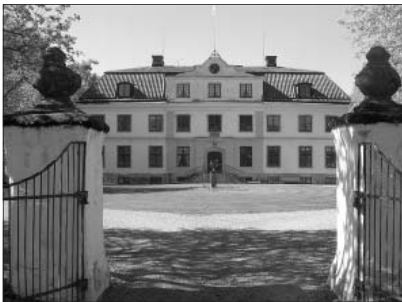
Värmlands Säby herrgård med anor från 1771.

Efter en färd till Gullspång där en välsmakande lunch intogs med lax på menyn var det dags att bese Frans G. Bengtssons bibliotekssamlingar och där fick vi också en intressant föreläsning av in-