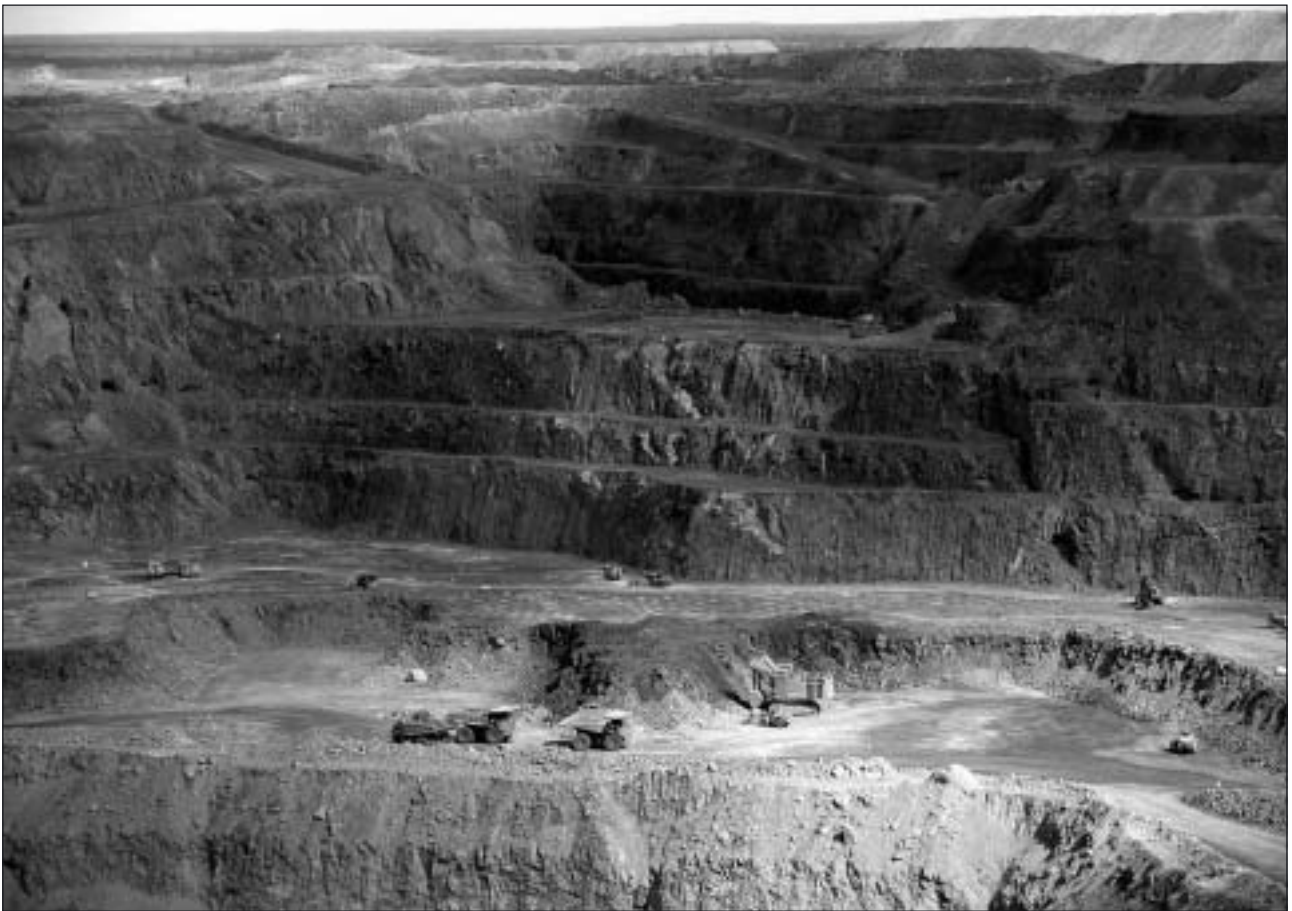
Hårt arbete med grävmaskiner och truckar i den öppna gruvan The Super Pit.

net att nå fram hela vägen och gruvdriften i Kalgoorlie kräver mycket vatten. Man räknar med att för varje gram producerat guld går det åt 150 liter vatten.