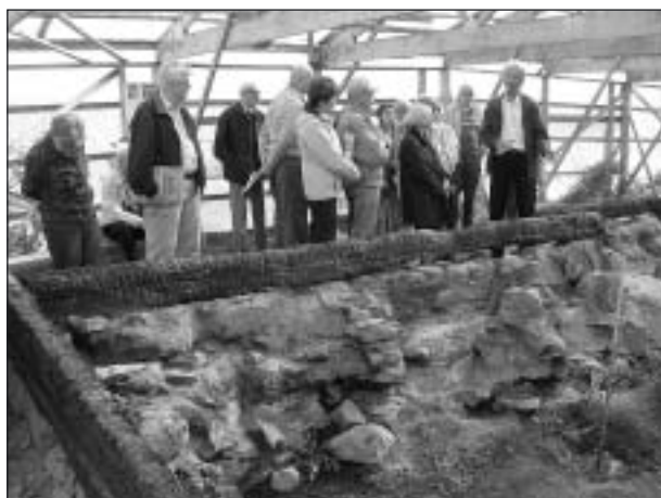
Endast brandrester återstår av kyrkoruinen.

Efter att vi fick ta del av ett intressant bildspel och tittat på det som nu återstår av kyrkoruinen och utgrävningarna var det dags för hemfärd efter en intressant dag med både kultur och historia.