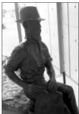
Staty över Paddy Hannan, som av en slump upptäckte guld i Kalgoorlie 1893.

Guldfebern startade i Australien då man 1851 upptäckte guld i Bathurst, New South Wales, och folk blev som tokiga. De lämnade allt vad de hade för att ge sig iväg till guldfälten och snabbt bli rika.