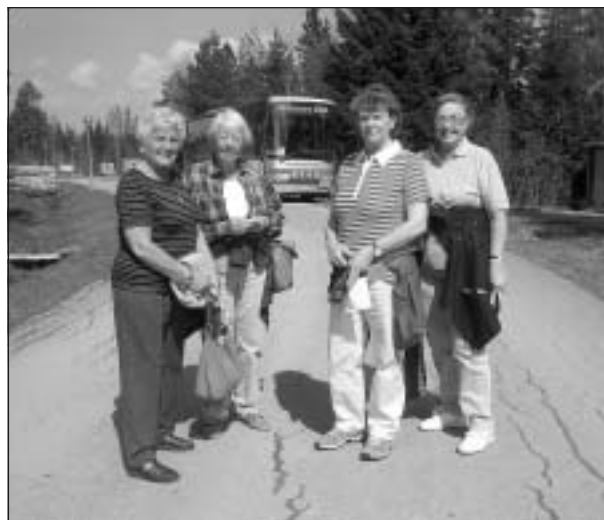
Fyra pigga damer efter väl förrättat värv på långa banan.