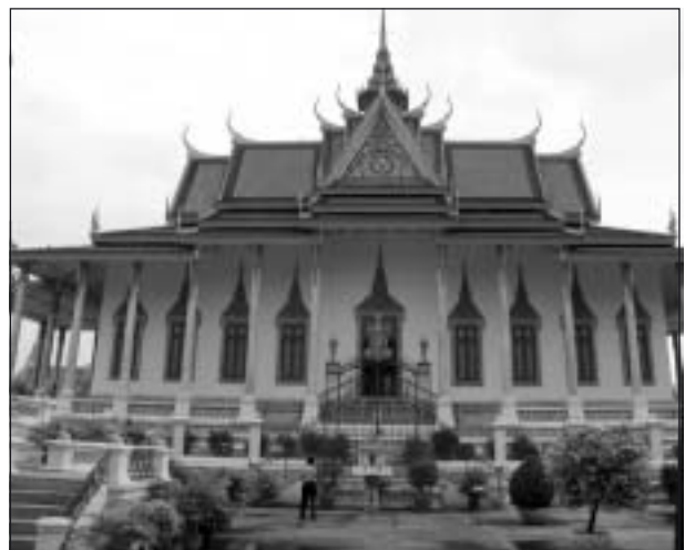
I Phom Penhs tempelområde ligger bl. a. Silverpagoden, vars golv är täckt av 500 plattor av rent silver vardera vägande ett kg. Här inne finns också en guldbudda dekorerad med över 9000 diamanter, den största på över 25 karat.

Text: Allan Hede med stöd av Ullas föredragsmanuskript