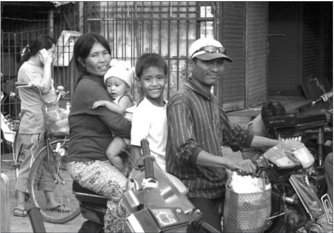
I dagens Phnom Penh är man rik, när hela familjen åker på sin värdefullaste klenod: Motorcykeln. Tala inte om säkerheten.

Höjdpunkten (av det positiva) i föredraget var dock bilderna och berättelserna från tempelområdena i Angkor. Detta är ett 20 km 2 stort område uppbyggt av de 39 kungar som härskade över Sydostasiens dominerande kungarrike under åren 802-1432 e.Kr. Dessa kungar var omväxlande buddister och hinduer vilket visar sig i byggnadsstilen. På 1400-talet erövrades området av thailändare och folket som bodde där jagades bort. Området blev i det närmaste folktomt och djungeln började ta över. Tydligast kan man se detta vid Ta Prohm-templet.