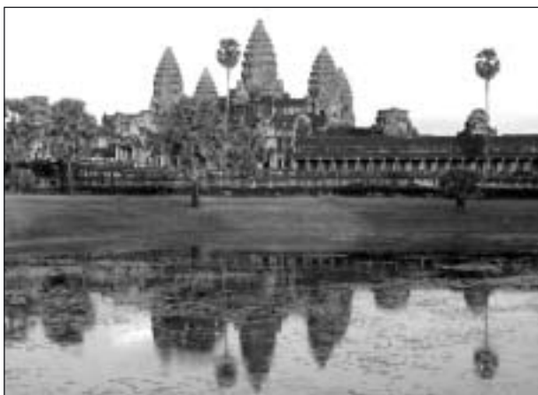
I Siem Reap ligger Angkor, världens största tempelområde (20 kvadratkilometer), som var i bruk 802-1432. I solnedgången speglar sig den enorma tempelbyggnaden Angkor Wat i dammen med lotusblommor.

Det är omöjligt att här på en sida i Månadsnytt ge en någorlunda fullständig och rättvisande beskrivning av Ullas fantastiska berättelse och de fotografiskt perfekta bilder som visades. Några avsnitt i denna berättelse som jag och sannolikt många med mig upplevde som speciellt intressanta (eller gripande) vill jag dock kort beröra.