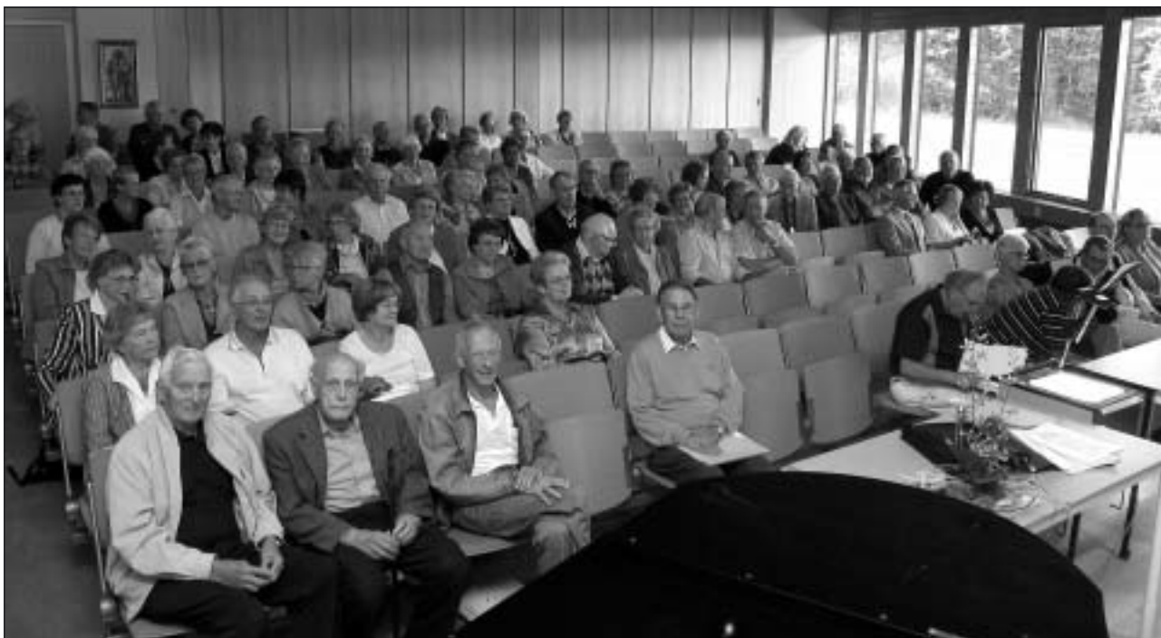
Över 90 funktionärer samlades på Folkhögskolan den 30 augusti till höstens funktionärs- och upptaksträff.

Förra kommunalrådet Margareta Karlsson Om ett gott ledarskap