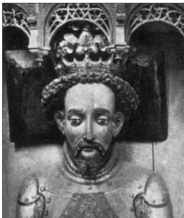
Albrekt var den förste svenske regent som tog symbolen Tre kronor till riksvapen.

Den 24 februari 1389 utkämpades i Falköpingstrakten vid Åsle mosse en drabbning som väl inte tillhör de mer bekanta. Det var då som invektiven ” Munkadejan ” och ” kung Byxlös ” lär ha tillkommit. Bakgrunden var denna: kung i landet var Albrekt av Mecklenburg. Han var släkt med de s.k. folkungarna genom Magnus Erikssons syster, Eufemia. Albrekt gjorde sig med tiden hjärtligt avskydd för översitteri och förtyskning av landet. Han fördrevs och istället valdes Valdemar Atterdags dotter, drottning Margareta i Norge-Danmark, till regent. Kung Albrekt räknade med att lätt kunna besegra Margareta som han föraktfullt kallade ”kung Byxlös”. För att chikanera henne sände han henne en brynsten för att skriva henne på näsan att hon borde stanna hemma och vässa sina synålar och inte utmana den mäktige kung Albrekt i strid! Drabbningen slutade emellertid med att Albrekt i grunden blev besegrad och tillfångatagen. Med detta gjorde han sin sorti ur vår historia. Margareta tog över och med henne skapades förutsättningarna för bildandet av Kalmarunionens spännande skede som sedan kom att dominera nordisk historia fram till Gustaf Vasas inträde på scenen.