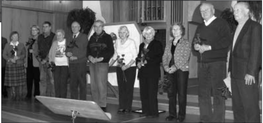
Som tack för sina funktionärsinsatser avtackades de här medlemmarna med en blomma.

med rabatt en speciell tid varje vecka. Men svaret har hitintills varit nej från handelns sida.