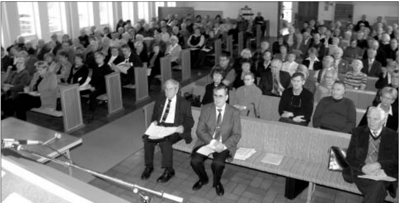
Det var nästan fullsatt i Missionskyrkan.