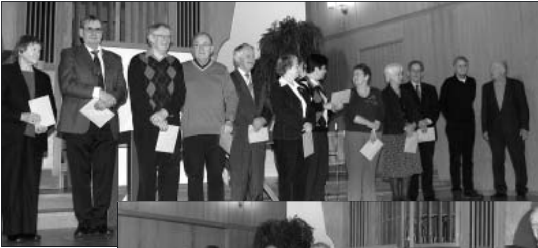
För 5-års funktionärsarbete fick dessa medlemmar en hedersgåva i form av ett diplom och ett presentkort.