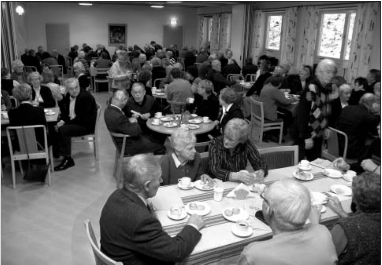
Efter själva årsmötet samlades medlemmarna till kaffeborden i samlingsalen.