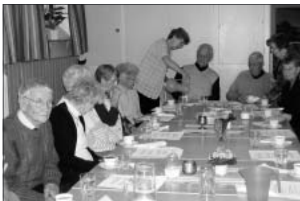
Kaffesugna på kafferepet.

Det var mitt första besök på kafferepet. Vardas sittplats runt långbordet fylldes av trevliga besökare.