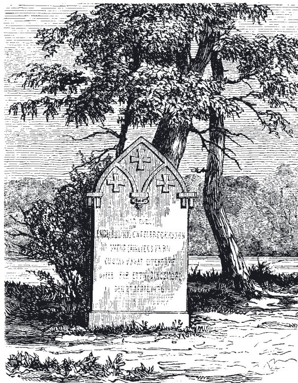
Ny illustrerad tidning 1865: Jernmonumentet på Engelbrektsholmen, där folkledaren Engelbrekt ljöt döden.

Han ljöt en våldsamt död liksom Tiburtius, men ej från en stör utan av ett yxhugg i huvudet. Det var den 27 april (år 1436) och detta datum är alltså sedan 1901 års almanacka Engelbrektsdagen. Det var då han med sällskap slog nattläger nära Göksholms slott vid Hjälmarens på en holme som senare döptes till Engelbrektsholmen och nu är landfast. Där dräptes han av Magnus Bengtsson Natt och Dag på grund av en familjetvist. Detta enligt den gamla rimkrönikan som har rätt i sak men fel i tid. Troligen skedde dråpet den 4 maj. Nutida forskare är överhuvud tämligen tveksamma till Engelbrekts roll i svensk historia både som nationell motståndsmann till Kalmarunionen och som grundare av den svenska riksdagen (Arboga möte 1435).