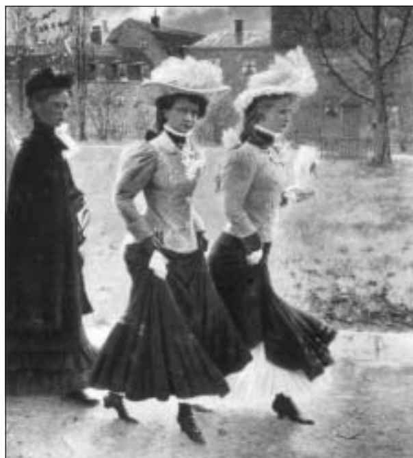
Så här kunde pingstkonfirmander se ut omkring år 1900 på väg till sin första nattvardsgång. Tiderna har förändrats!