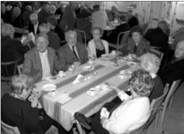
Många kända ansikten kring ett av kaffeborden.