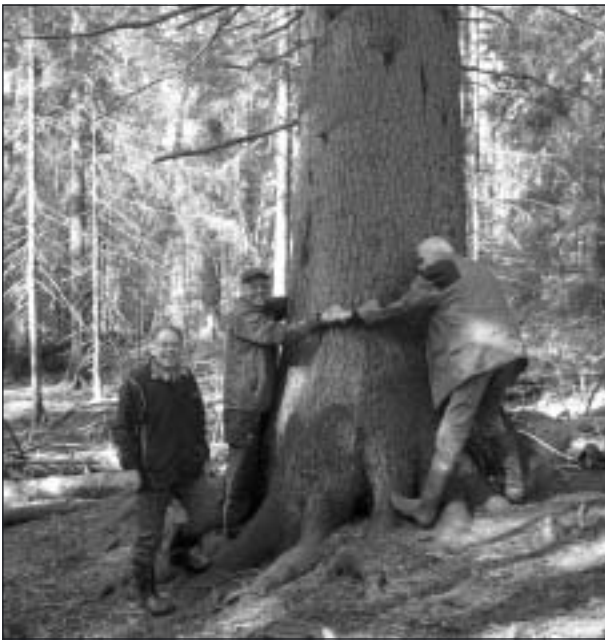
Duvedalsgranen är en av de största i Sverige. Den är 3,65 m runt om i brösthöjd och c:a 40 m hög och är verkligen imponerande. Tre karlar behövdes det för att nå runt den.