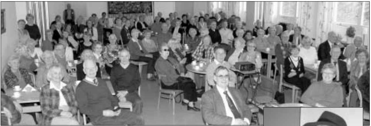
En glad och stor publik underhålls . . .