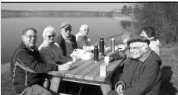
Tillbaka vid rastplatsen satte vi oss vid picknickborden, plockade fram våra kaffekorgar och njöt av solen och glittret över Möckeln.