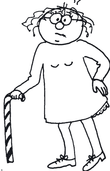
Ur Gunilla Dahlgrens Lilla fruntimret vet bäst

Det är inte ålderskrämpor jag har fått. Det är idrottskador. Så det så.