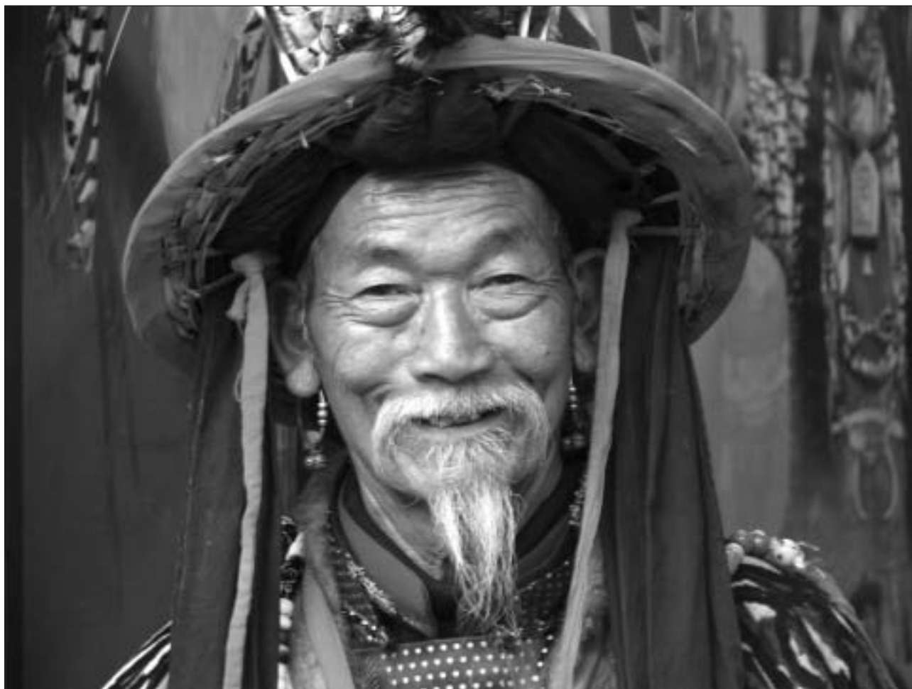
En tibetansk byhövding från en by i provinsen Yunnan i sydvästra Kina hälsar Månadsnyttts läsare den här månaden. Yunnan gränsar till Tibet och många av folkslagen här är genuint tibetanska.