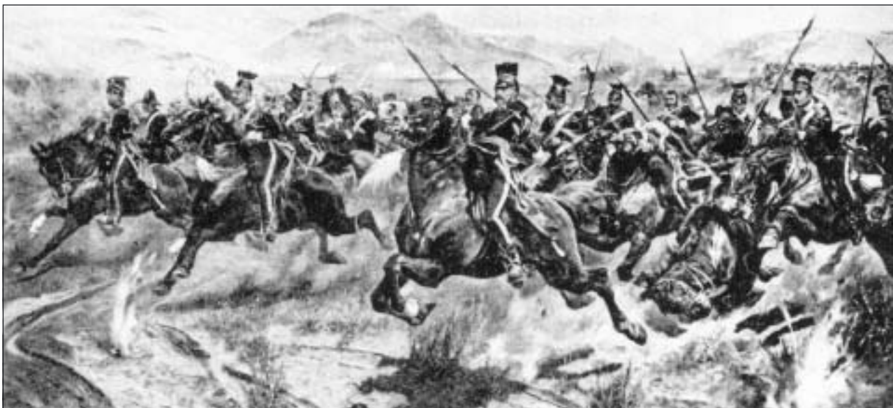
Lätta brigaden anfäller vid Balaklava.

Mörka skyar öfver himlen jaga, Solens sköna blick är blek och matt, Foglarne med hast till Södern draga, Stormen sjunger i en längre natt