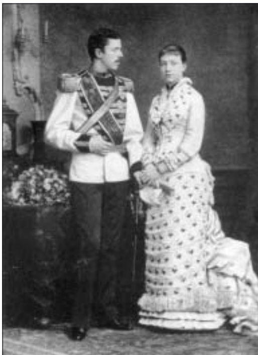
Nyförlovade 12 mars 1881: Kronprins Gustaf och prinsessan Viktoria. När kommer motsvarande bild på vår kronprinsessa?

Pesten gav oss också ett nytt ord, ”karantän” , från Venedigs förbud för fartyg att landa med misstänkta pest-smittade före 40 dagar, ”quaranta gioni”. Via franskans ”quarantaine” (= 40) blev det med tiden vår läkarterm ”karantän”. Så fick digerdöden också ett språkligt avtryck i historien. Så kan det gå!