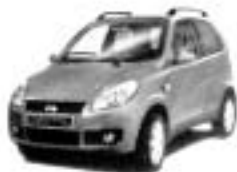
Moped-bil Ligier X-Too R