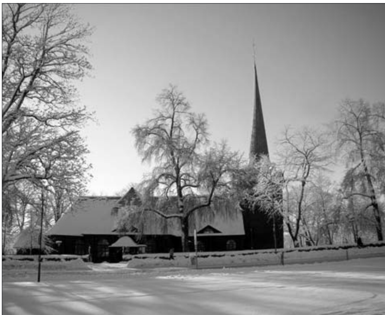
Karlskogas vackra kyrka en vintermorgon i februari månad.

Sveriges Pensionärsförbund – Seniororganisationen i tiden Karlskogaföreningen