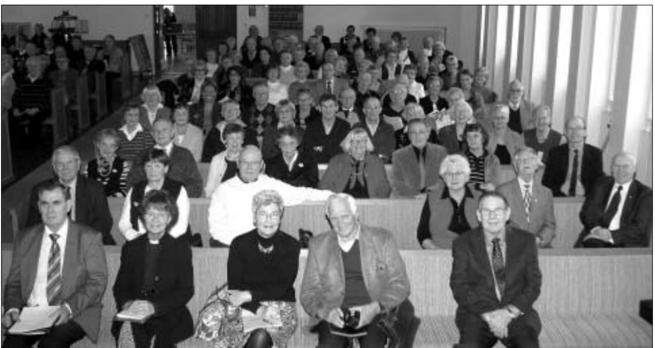
Ett välbesökt årsmöte.

När det gällde valet av personer till de olika kommittéerna blev det lite mer komplicerat. Men med tanke på det stora antalet personer som är engagerade i föreningsarbetet så har det också varit ett omfattande arbete för valberedningen att få alla namn på rätt plats. I sista stund hade det också dykt upp vissa ändringar, men efter en stunds diskussioner tycktes alla namn emellertid komma på rätt plats. En komplett förteckning över vilka som