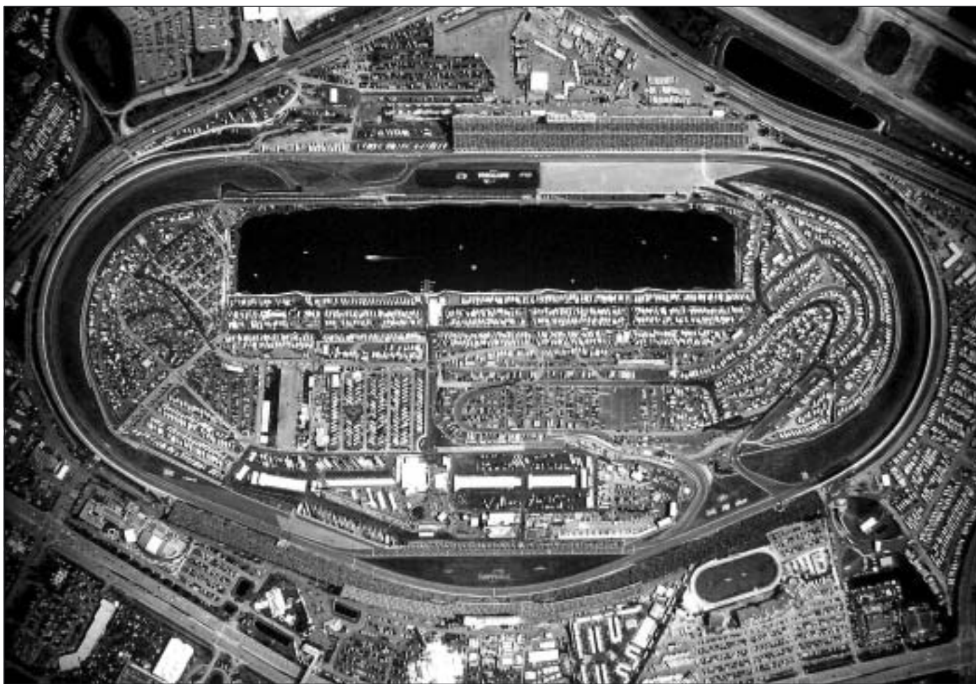
En flygbild rakt uppifrån av Daytona Speedway (= Motorstadion på amerikanska) en 4 kilometers rundbana, där medel hastigheten ligger på 250 km/tim.