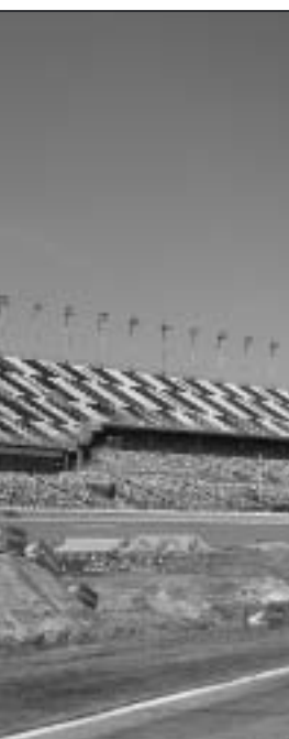
10 åskådare.