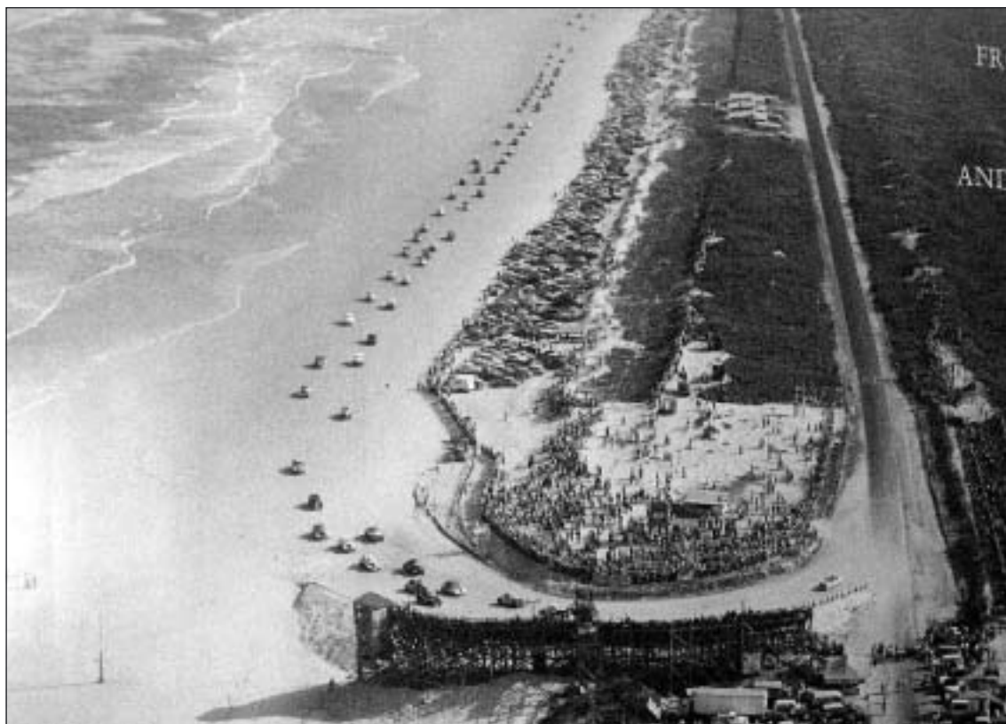
Från 1936 till 1959 var stranden vid Daytona Beach racerbana för bilar och motorcyklar. Här syns Norra kurvan där mycket hände under årens lopp.