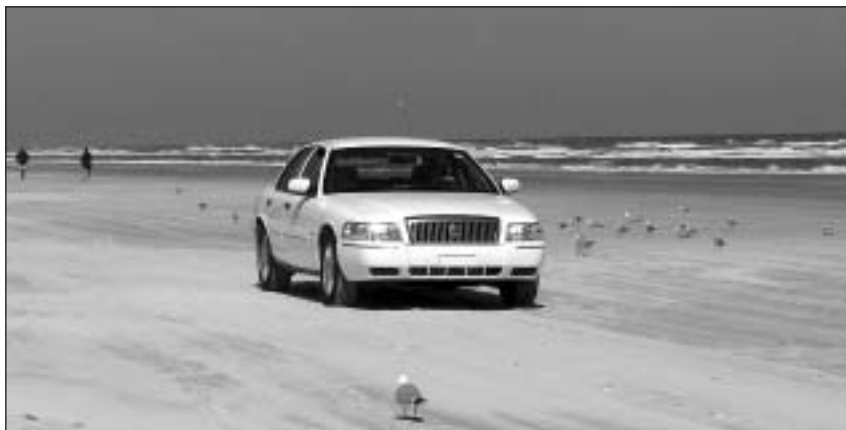
Numera går det lugnare till på stranden. Här får man köra med egen bil, dock högst 15 km/tim, och måsarna härskar.