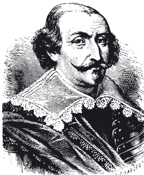
En duktig kung med hårda nypor och Karlskoga Bergslags grundläggare –men 1611 dummade han sig.

Någon duell blev det naturligtvis inte. Kriget rullade vidare i dansk favör. Älvsborgs fästning, en annan av "rikets nycklar" intogs och Stockholm hotades av den danska flottan. De höga krigskostnaderna tvingade dock sedan Kristian IV till fredsförhandlingar som resulterade i freden i Knäred 1613.