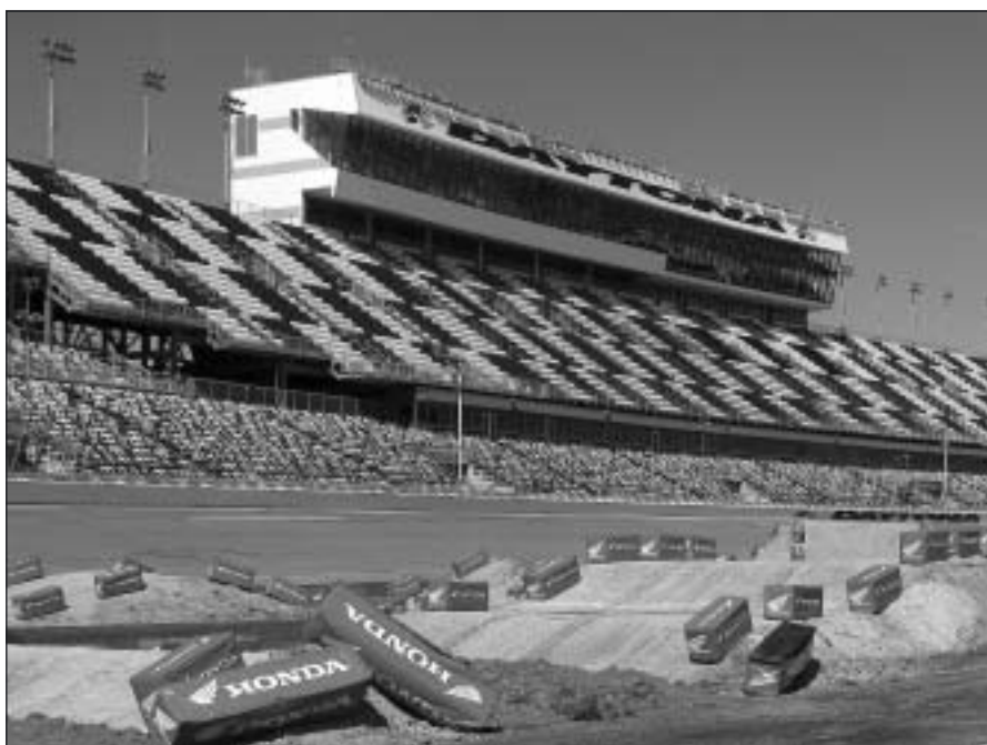
Huvudläktaren på Daytona Speedway är imponerande, totalt rymmer stadion över 200 000 åskådare.