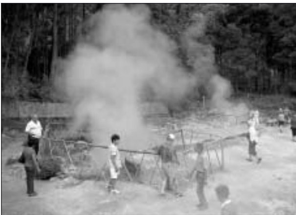
Vulkanisk aktivitet i marken.

och för övrigt vita. Vackert kakel såg vi ofta både utanpå och inuti byggnader, vilket är vanligt i Portugal.