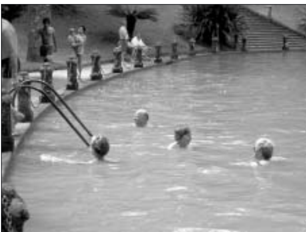
Några av oss som badade i Ungdomens Källa.

Förutom alla vilda blommor har man också planterat mycket för att pryda upp vägarna. São Miguel's speciella kännetecken är hortensiorna som ofta finns längs vägkanterna som stora buskar, oftast med blå blommor. En mycket vacker blomma med jättestora gula blomställningar kallas på svens-