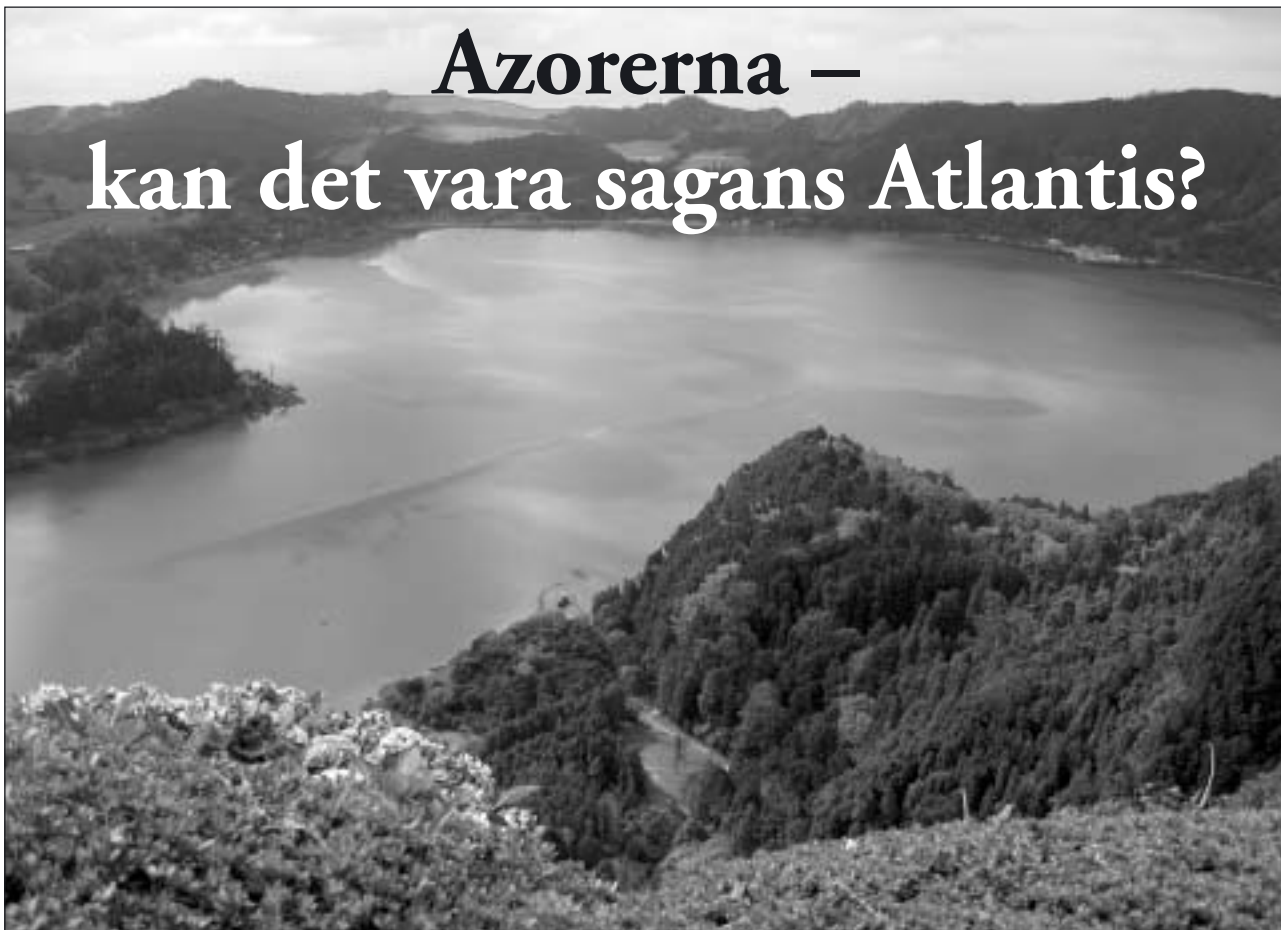
Furnassjön sedd från kraterkanten.

Azorerna är en grupp om 9 öar i Atlanten, ungefär på Lissabons breddgrad och 150 mil från Portugals fastland. Vi som nyss varit där vill gärna berätta något om detta paradiset av naturupplevelser.