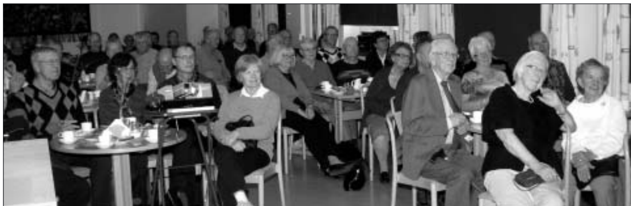
En del av den andäktigt lyssnande publiken.