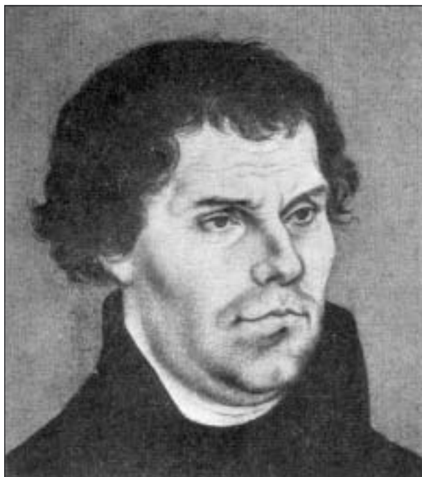
Han var inte en dysterkvist!

Så lyder slutorden i ett välbekant försvarstal fällt av en tysk augustinmunk som gått till historien. De hör hemma i ett dramatiskt skede under 1500-talet, framkallat av det förfall som drabbat påvekyrkan och förstärkt av den s.k. avlatshandeln. Den innebar penninggåvor till kyrkan eller i klartext: det var påvens skändliga sätt att få in medel till fullbordandet av den nya Peterskyrkan i Rom, varigenom den syndfulla kunde köpa sig fri från skärseld och bövningar eller som det hette: ”När i kistan pengarna klinga, ur skärselden själarna springa.”