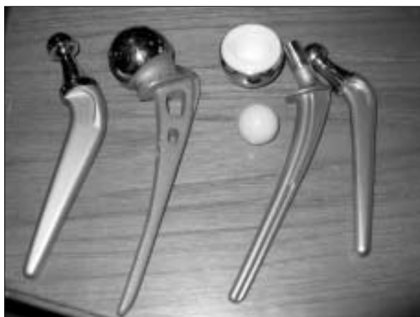
Olika typer av höftledsimplantat.