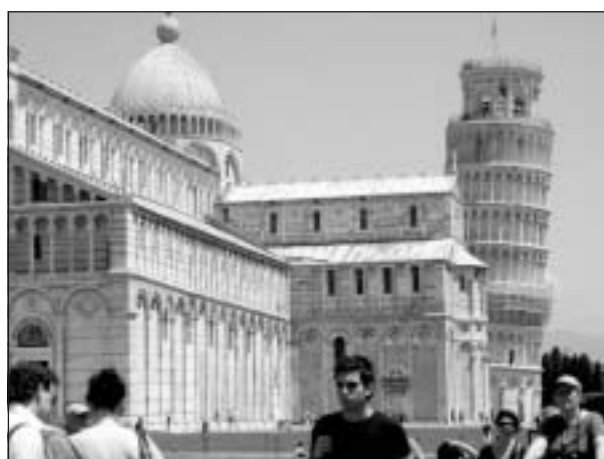
Pisa med Baptisteriet och kampanilen (lutande tornet) och den intilliggande Domen är populära sevärdheter i Italien,