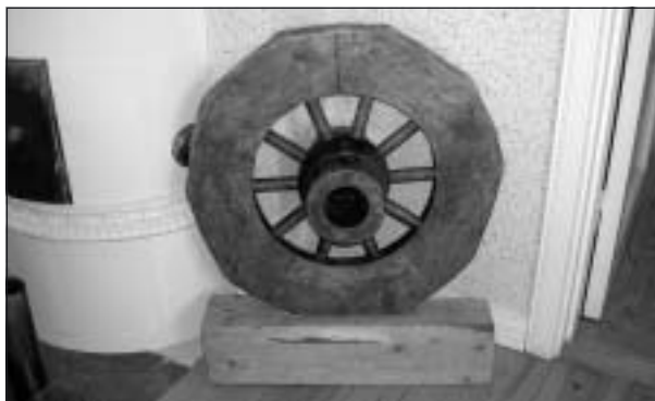
Vårt lands bäst bevarade hjul från förhistorisk tid, ca 400 e. Kr. är Mellöshjulet. Det är 10-ekrat, 65 cm i diameter och med ett 35,5 cm långt nav. Det hittades 1933 vid en dikesgrävning i Mellösa i Södermanland och förvaras nu på Statens Historiska museum i Stockholm.

Vagnshjulet bestod åtminstone de första tusen åren av en solid skiva hopfogad av tre eller flera bräder skurna som cirkelsegment och sammanhållna av tvärställda stag. I centrum fanns en öppning för en axel som stack ut en bit utan för hjulet. Det är inte känt hurvida hjulet roterade på axeln kring ett nav eller om det