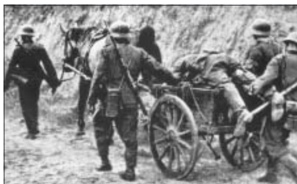
Ett annat sätt att lämna fronten med bukskott

med stor manspillan på både tysk och rysk sida. Slutligen lyckades sovjetarméerna inringa hela den tyska 6:e armén och alla tyska undsättningsförsök misslyckades. Därmed var arméns öde beseglat. Den 2 februari 1943 kapitulerade de sista trupperna.