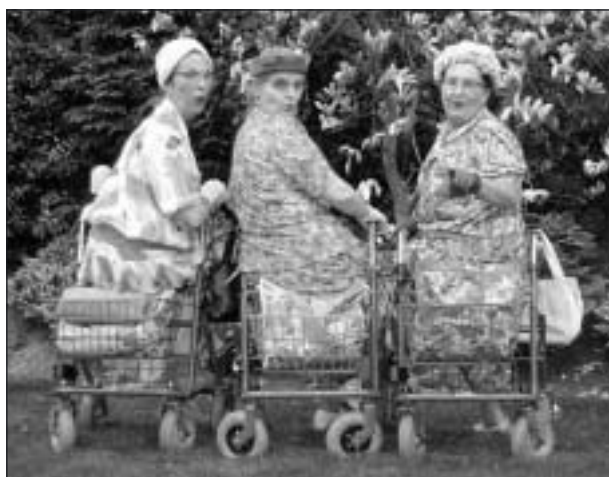
Man kan undra hur våra rollatorer skulle sett ut om inte hjulet hade uppfunnits.

Källor: Charles Panati: Aha–var det så det började, Vingapress 1985, Nationalencyklopedin och Wikipedia.