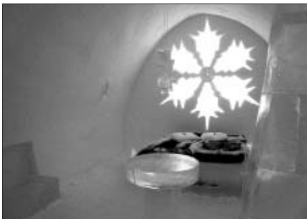
Ett av sovrummen i Ishotellet.

Så övergick vi till en mera teknisk begivenhet, Esrange, alltså den civila raketbasen norr om polcirkeln. Också där hade vi en trevlig och engagerad guide som lärde oss mycket om rymden. På återvägen gjorde vi ytterligare ett besök på Ishotellet och kunde avnjuta det vi missat på förmiddagen.