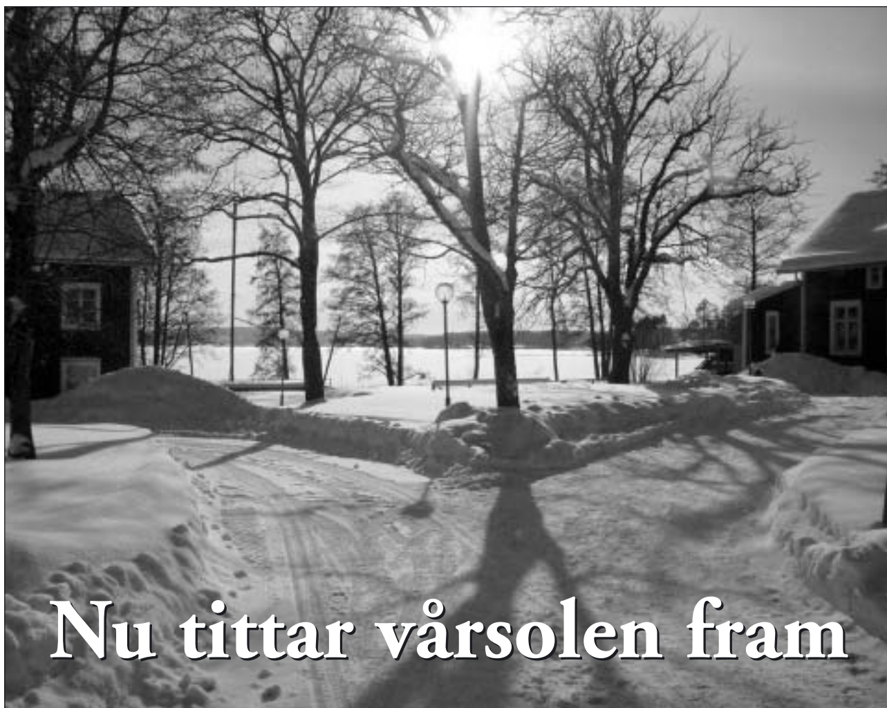
Vårvinterbild vid Grönfeldtsudden.

Sveriges Pensionärsförbund – Seniororganisationen i tiden Karlskogaföreningen