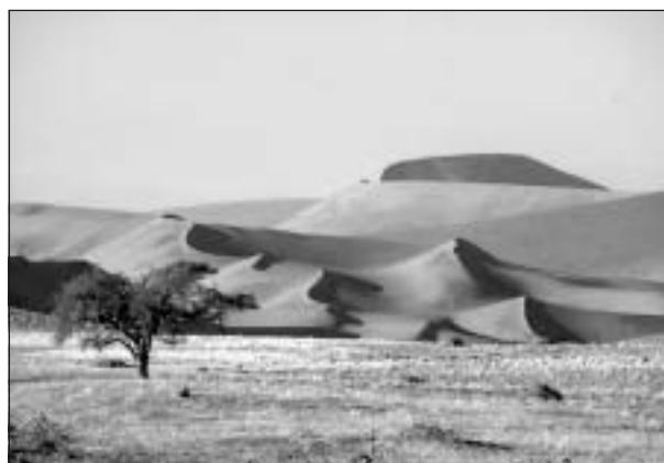
Landskapsbild från Namibia.

Det fanns mark där man kunde slå läger och bland annat se flodhästar, Afrikas farligaste djur. I detta vattenrika område fanns det mängder med fåglar, t.ex. ett slags kungsfiskare (brown headed kingfisher), ugglor, biätare, hägrar och fiskörnar. Andra djur som förekom var elefanter och olika slags antiloper. De har lärt sig att vara rädda för en ensam svart man, men däremot inte om han har vita med sig. När han är ensam har han ofta gevär, och det vet antiloperna.