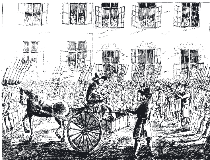
Rackarkärnan på väg till avrättningsplatsen.

Historiker idag är tämligen överens om att Anckarström hade en klar ideologisk uppfattning, men att han ingalunda var den besinningslöse mörkman som våra historieböcker utmålade honom. Hans efterkommande tog senare namnet Löwenström och lade genom donationer grundplåten till det välbekanta Löwenströmska lasarettet utanför Stockholm.