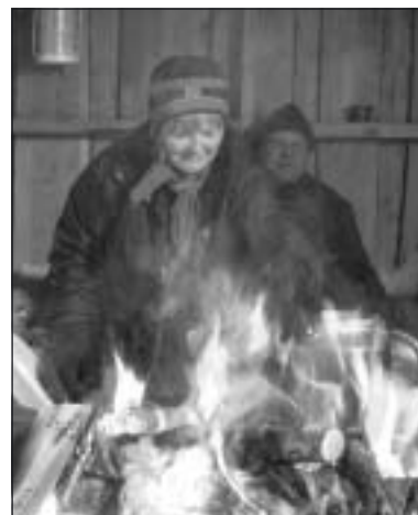
Elden värmd i lappkåtan.

Nästa dag tittade vi på det imponerande stadshuset. Det framgick att Kiruna tack vare gruvbolagets goda intäkter hade en god ekonomi, för det var en jättebyggnad med mycket konst, en vacker stadsfullmäktigesal och ett litet bibliotek, som i sig själv var ett konstverk.