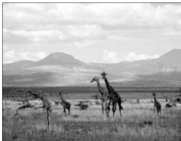
Giraffer på savannen.