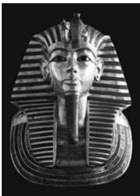
Tutanchamons ansiktsmask av guld.