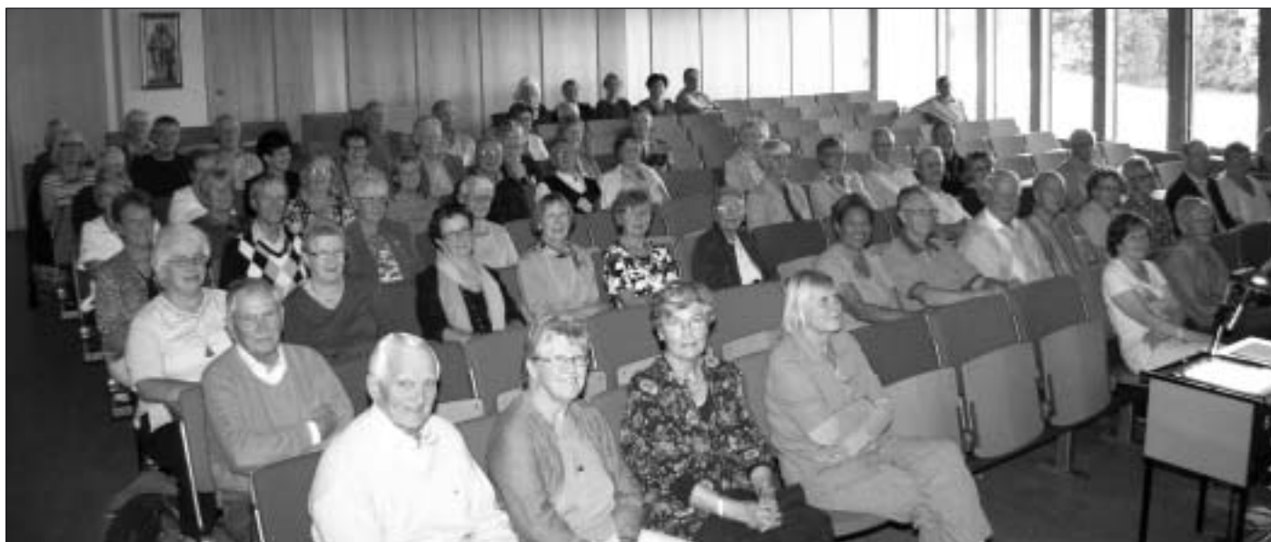
Funktionärerna samlade i Folkhögskolans aula.

Den 31 augusti var det dags för höstens Funktionärsträff. Även denna gång var den förlagd till Folkhögskolan och ca 80 funktionärer hade hörsammat inbjudan.