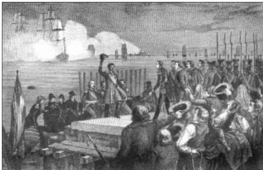
Den svenske kronprinsen landstiger i Helsingborg den 20 oktober 1810.

Hur det gått för vår bernadottska dynasti sedan vet vi. Låt oss avslutningsvis bara konstatera att av alla de dynastier som sattes på Europas troner under de oroliga Napoleonkrigen är det endast familjen Bernadotte som sitter kvar.