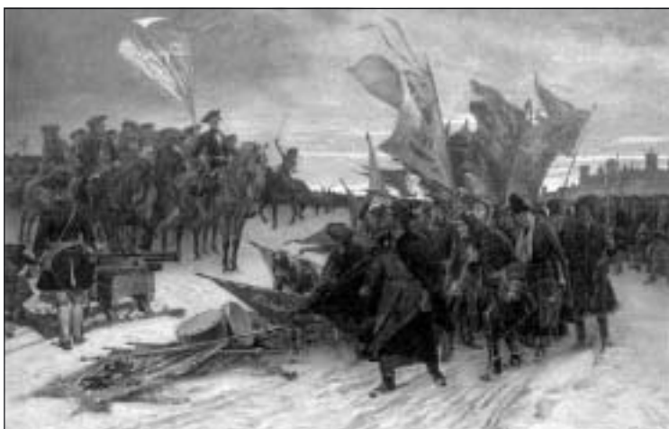
Cederströms patriotiska målning av ryssarnas kapitulation vid Narva.