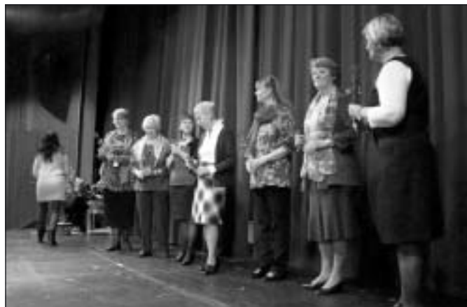
Mannekängerna från Larssons Mode avtackades.

Efter en paus var det dags för en uppskattad modevisning. Det var sex damer som visade snygga och användbara höstkläder från Larssons Mode i Sandviken. Roligt att se mannekängerna som ser ut och går som folk och visar kläder som man skulle kunna ta på sig (jämfört med modehusens visningar).