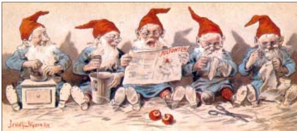
Året är 1902 och jultomtarna hinner koppla av, fångade av Jenny Nyströms penna.

En av månadens huvudpersoner är som bekant Tomten . Hans hemvist råder delade meningar om. Vi vet att han bor i Mora, men finnarna påstår att han huserar i Rovaniemi, medan danskarna håller på Grönland, norrmännen på Dröbak och amerikanerna på Nordpolen. Och i år har "vetenska-