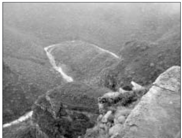
En blick ner i Blyde River Canyon.

Eller när Blyde River på ett annat ställe kastar sig utför ett brant stup i en forsande ström vid Bourkes Luck Potholes.