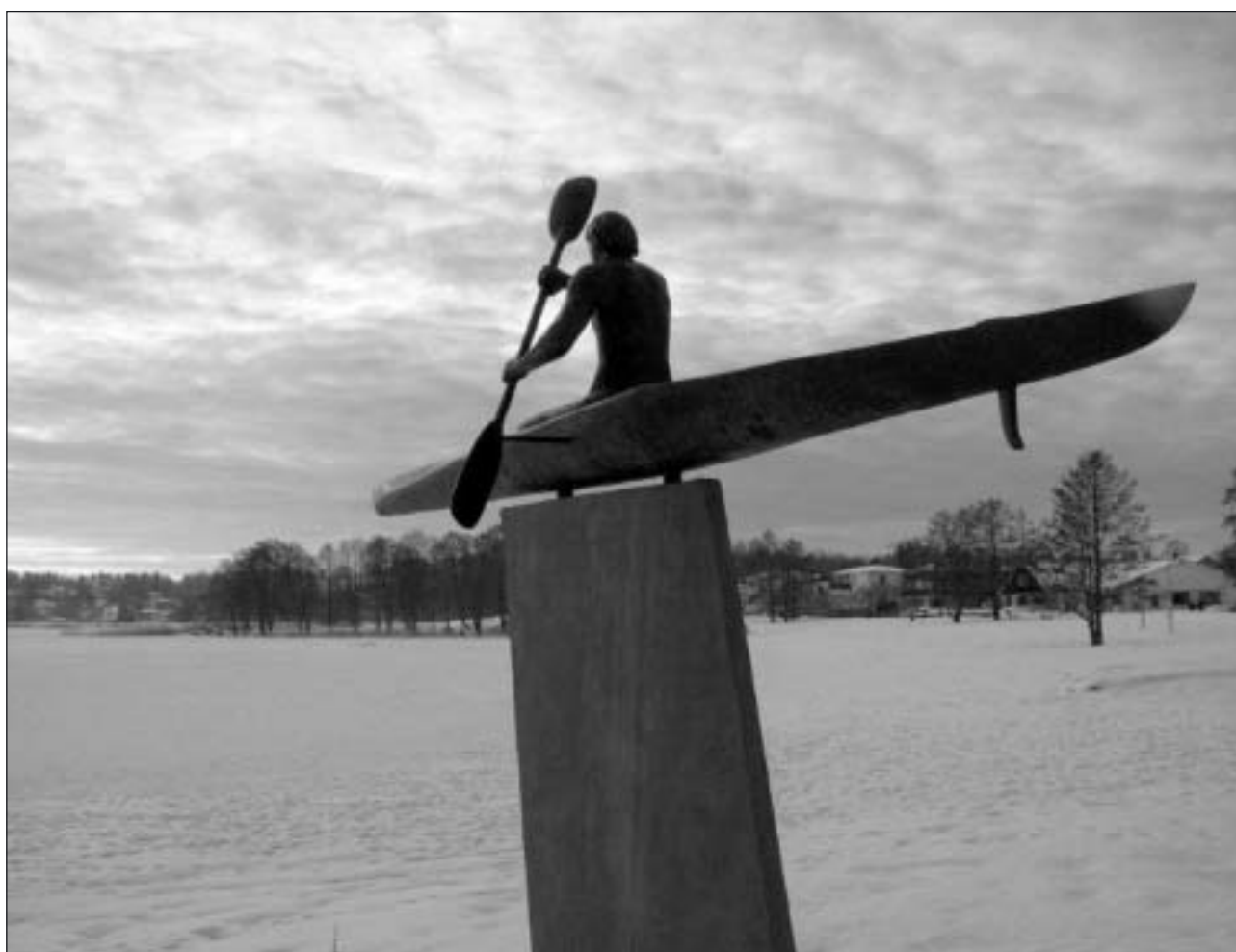
I väntan på våren en vintrig dag i januari. Konstverket med guldolympiern Agneta Andersson vid Möckelns strand.

Sveriges Pensionärsförbund – Seniororganisationen i tiden Karlskogaföreningen