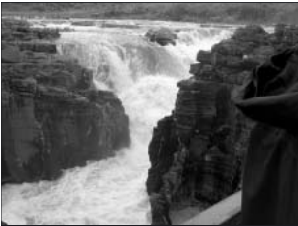
Bourkes Luck Potholes.

Bourke var en guldgrävare som övergav sina gruvhål vid floden till förmån för en annan guldgrävare. Denne blev rik på guld som han hittade just på andra sidan floden (platsen fick därför det ironiska tillägget "Luck" i namnet).