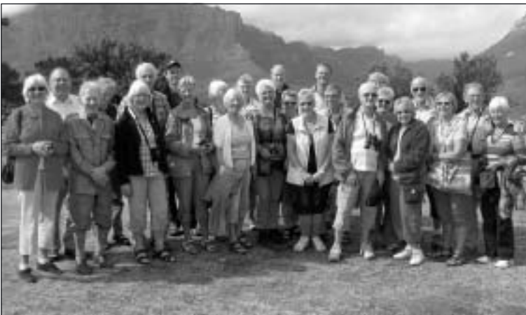
Deltagarna i SPF-resan.

SPF:s sexton dagar långa resa till detta avlägsna resmål blev en verklighet som vida överträffade vad vi alla hade föreställt oss. Detta inte minst tack vare vår utmärkte inhemske guide Nico som talade flytande svenska.