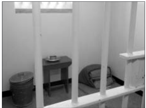
Fånge 455/64 Nelson Mandelas cell.

En mycket stark upplevelse var besöket på Robben Island, fängelseön utanför Kapstaden. Robben Island blev ett gripande men också glädjande möte, då ön inte längre är ett fängelse för olikänkande utan ett nationellt museum.