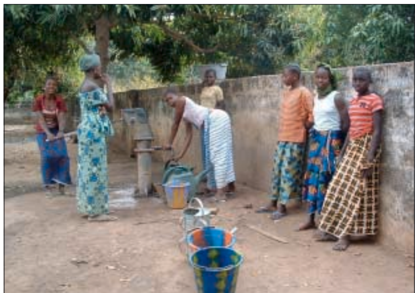
Vid byns brunn.