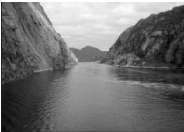
Vy inifrån Trollfjorden.

te med Trollfjord enkel resa. Det tog 6 dagar och 5 nätter. Då hade man tillryggalagt 1250 sjömil, ungefär 200 mil.