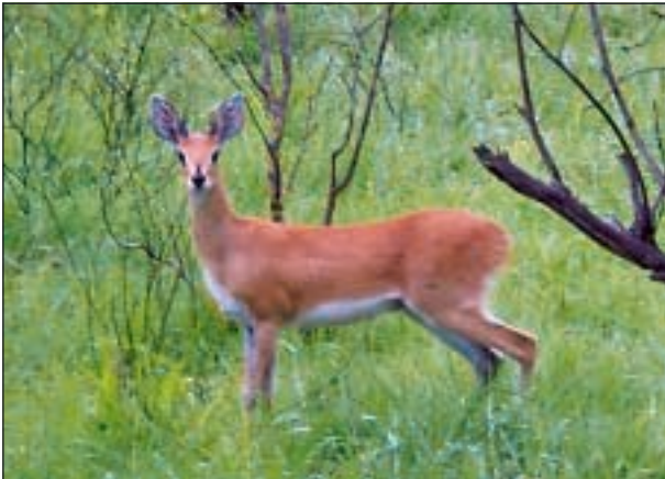
Den vackra impalan är alltid vaksam.