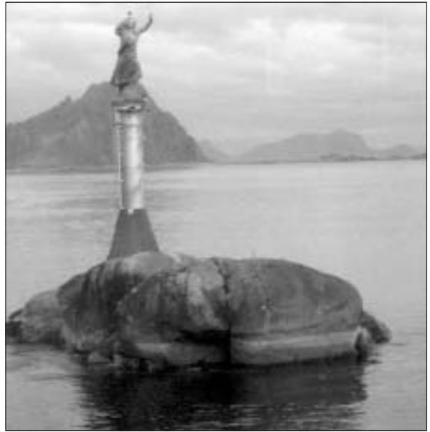
Spanande fiskarbustru i hamninloppet till Svolvær.