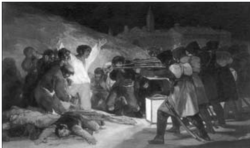
3 maj 1808: spanska patrioter avrättas av fransmännen

Goya upprördes av Napoleons härjningar och införlivande av andra länder och den hårda regim där all opposition tystades med maktspråk. När detta brutala uppträdande kom att drabba hans eget hemland protesterade han häftigt och gjorde ovannämnda målningar där han skildrade krigets fasansfulla råhet med detaljerad realism. Mest bekant blev bifogad bild. Den är ovanlig i flera avseenden: I centrum står en enkel, namnlös motståndskämpe och rädslan inför döden lyser ur hans ögon. Hans vita skjorta kontrasterar starkt mot omgivningen: han är upplyst som en Kristusgestalt med armarna utsträckta, medan exekutionspatrullen skildras anonymt utan ansikten. Här betonas skräcken – och det var just sådana krigets fasor som Goya ville uppmärksamma oss på. Originalmålningen finns i Pradomuseet i Madrid och är en av museets största publikmagneter.