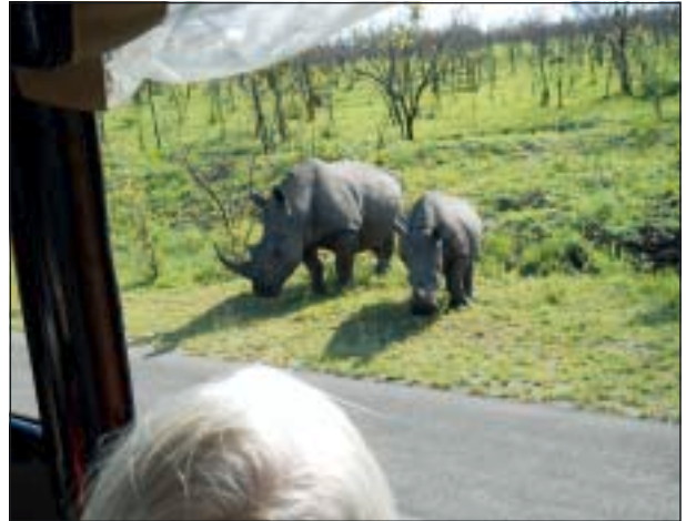
Bekymrad noshörningsmamma: Vågar vi gå över?

Efter en inledande beskrivning av resan med stöd av bl.a. en Sydafrikakarta startade Roland sitt fina