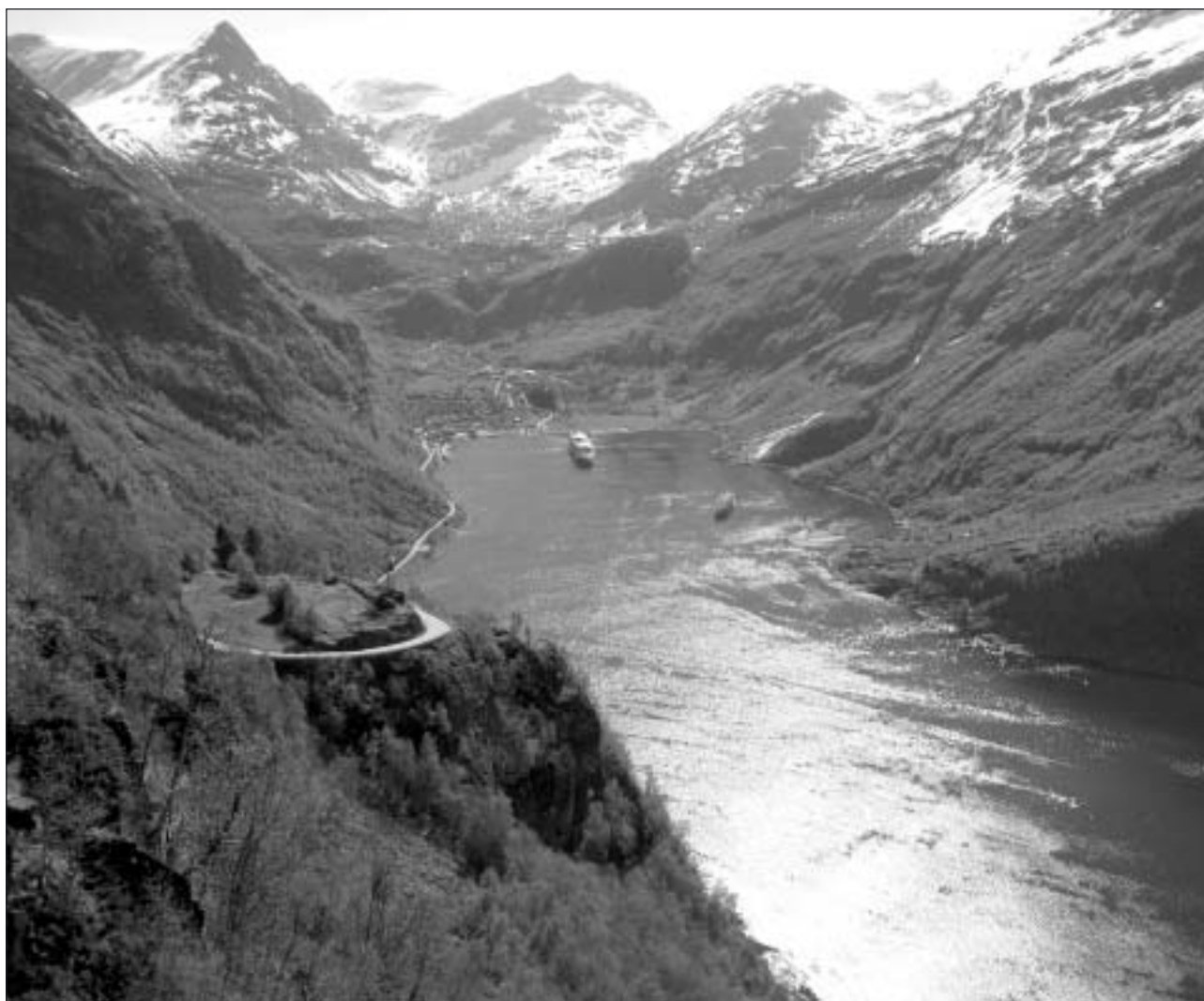
Geirangerfjorden med omgivande gnejsfjäll, bl.a. Dalsnibba 1495 m.ö.h. En av många fjällbilder som kommer att visas på Lördagsträffen den 10 september.

Sveriges Pensionärsförbund – Seniororganisationen i tiden Karlskogaföreningen