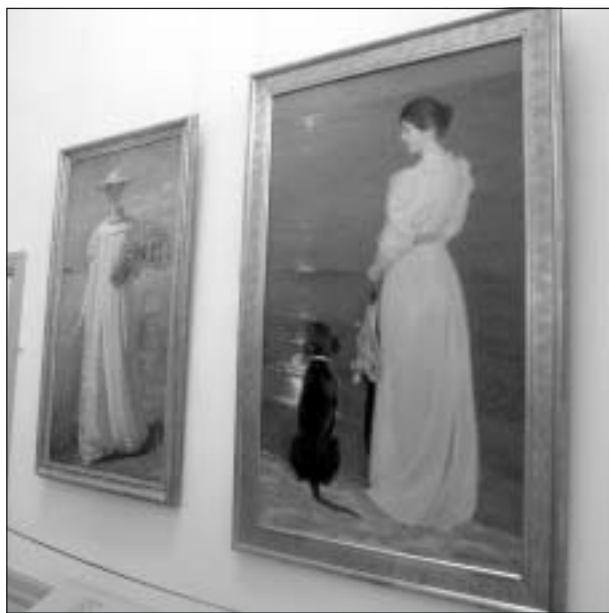
Ett par av Skagemuseets kända målningar.

Efter frukost nästa dag åkte vi till Skagen där vi besökte konstmuseet och beundrade verk av de kända Skagenmålarna. Ljuset här har lockat hit konstnärer. Det kan man förstå när man ser tavlor.