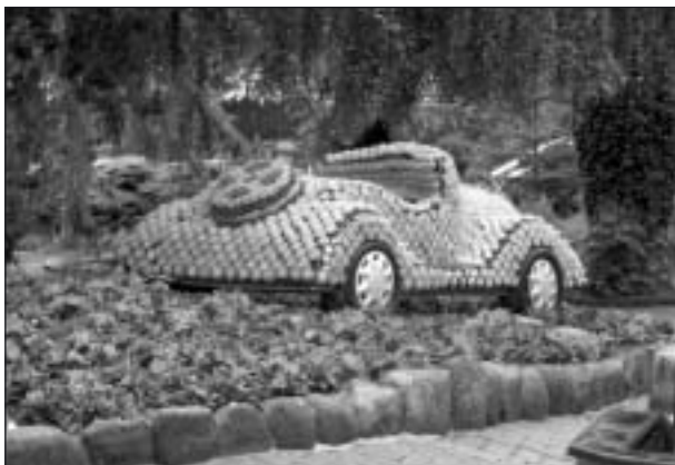
Kaktusbil på Jesperhus.

Dagen fortsatte med ett besök på Jesperhus som ligger på en udde i Limfjorden. Jesperhus har utvecklats och blivit Nordeuropas största blomsterpark. Det var verkligen storslaget med alla blommor och blomsterarrangemang. Här fanns avdelningar med ormar, gnagare och även fjärilar. Dessa områden hade tak över sig så vi slapp besväras av regn.