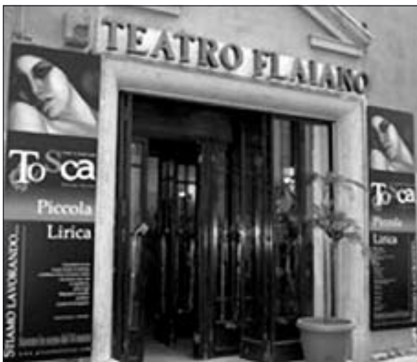
Teatro Flaiano i Rom.

Vi kom i god tid och köpte biljetter. Lite före kl. 20 när operan började skulle jag besöka toaletten, en trappa ner. Jag gick och trappan tycktes vara slut, men det var något slags extra trappsteg som jag inte såg. Jag tappade förstås balansen och i mina försök att komma på rätt köl lyckades jag ramla baklänges och slog i huvudet. Självklart skrek jag till och det blev en uppståndelse utan like.