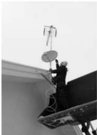
Antenninstallationer året om