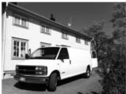
Service on-site hos kund

Ljudfabriken Service AB, Noravägen 1, 691 53 KARLSKOGA, 0586 - 333 77, info@ljudfabriken.se