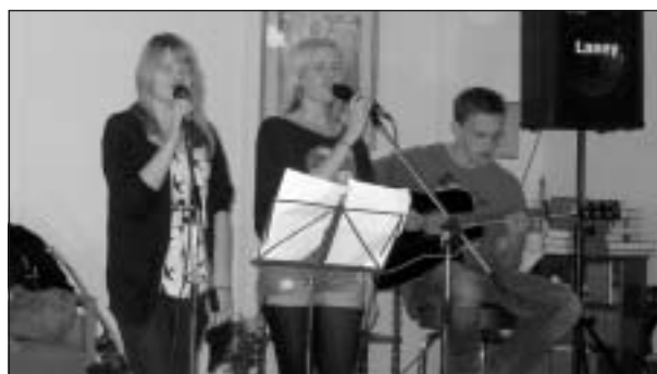
Flickorna sjöng bra och gitarristen var suverän.

Juridiken ”krävde” en kaffepaus och sedan kom en grupp elever från Karlbergsskolan och sjöng och spelade för oss. Det var elever från årskurserna 7 – 9 och de bildade flera olika grupper om 2 eller 3.