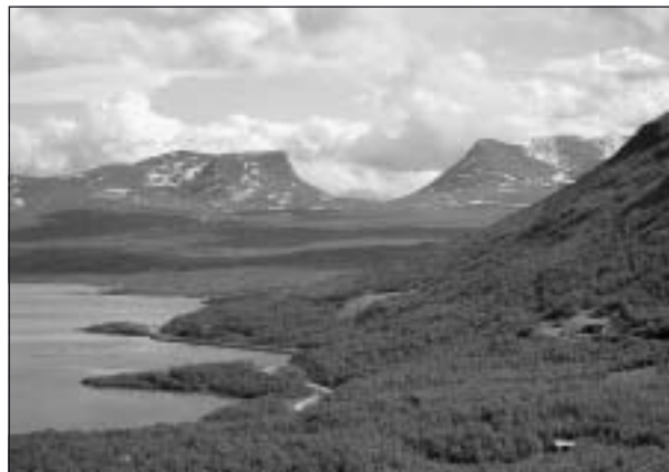
Lapporten söder om Abisko.