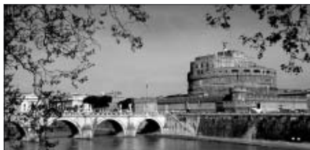
Castel Sant' Angelo i Rom.

Jag fick hjälp upp i foajén, ambulansen kom med blåljus och allt, och in stegade en man och en kvinna. Han talade som tur var engelska (min italienska är något begränsad) och sa att det här måste sys. Men det var inte panik, om jag kunde och ville se föreställningen så fick jag det, men jag måste lova att åka till sjukhuset sen. Jag kände mig inte