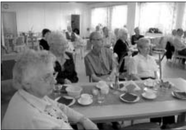
Publiken lyssnade koncentrerat.

Genom engagemang, kunskap och inspirerande samtal gjorde Sif 80+-träffen till en gemytlig stund. Många minnen väcktes hos åhörarna. Vi fick ta del av tillbakablickar och spontana berättelser. Efter kaffe, smörgås, sång, historier och lite samtal om höstträffen önskade vi varandra en glad vår och sommar.