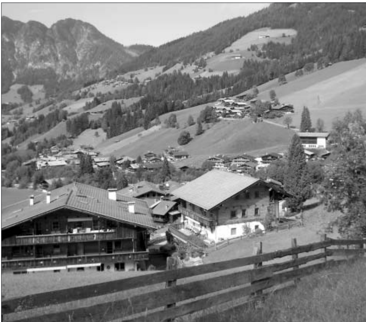
Sommar i Tyrolen.

Sveriges Pensionärsförbund – Seniororganisationen i tiden Karlskogaföreningen