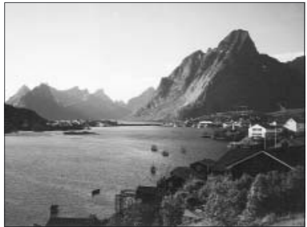
Reine på Lofoten.

För ca 100 miljoner år sedan var fjällkedjan till stor del nederoderad, men den trycktes upp 1 – 2 km, då Alperna bildades. Lofotenfjällen har fått sin alpina karaktär genom att de inte har varit helt täckta av is.