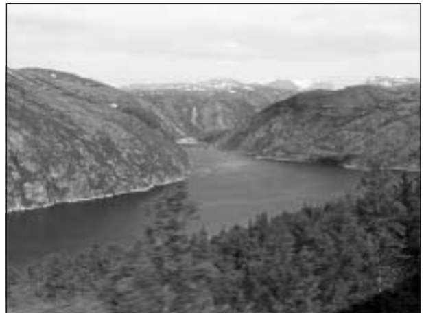
Rombakfjorden från malmbanan öster om Narvik.

Vi fick se geografiska tvärsnitt av fjällkedjan, t.ex. Narvik – Kiruna, där Allan kommenterade och förklarade de olika områdena allt kompletterat med vackra och talande bilder.