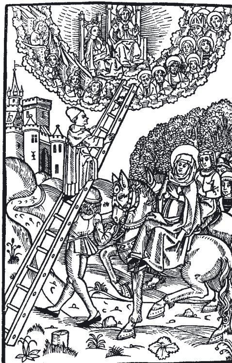
Känt träsnitt ur Birgittas Revelationer: Birgitta till häst ser en munk som är på väg till himlen för att disputera med Gud.

”Något tålte hon skrattas åt men mera hedras ändå”