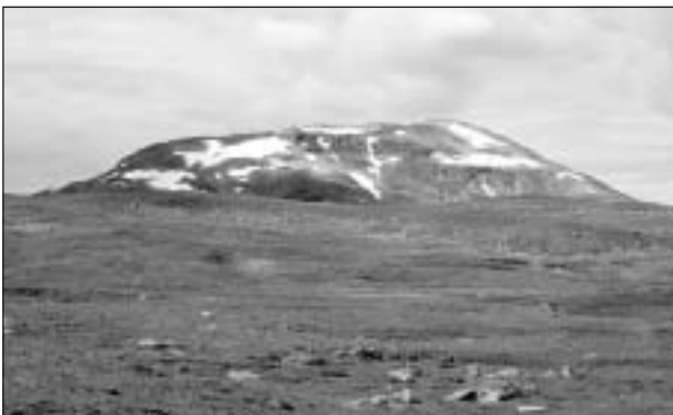
Gränsfjället Sipmeke söder om Stekenjokk. (Lättillgängligt fjällområde på svenska sidan.)

Skollorna indelas i undre, mellersta, övre och översta skollberggrunden. Beroende på omvandlingsgraden i samband med överskjutningarna har de bildade bergarterna fått olika karaktär. Detta är orsaken till att fjällen i Sarek är högre och vildare än i Padjelanta och övriga lapplandsfjäll intill gränsen.