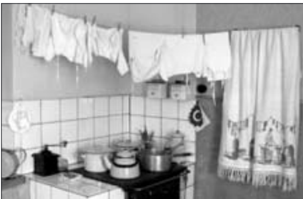
Ett kök som det såg ut år 1942.