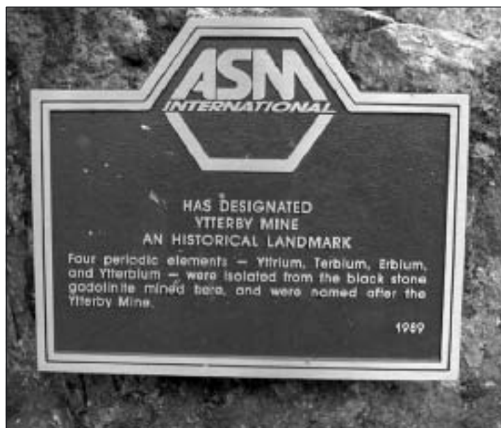
Utmärkelsen "Historiskt landmärke i metallernas utvecklingshistoria", en av de sex utmärkelser som utdelats i Europa av American Society of Metals