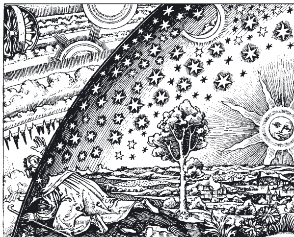
En medeltida världsbild: en vetgirig gubbe tittar ut genom himlavalvet och ser de sju planethimlarna.

Den 13 februari 1633 ägde en uppmärksammad rättegång rum i Rom inför inkquisitionens domstol. Denna hade till uppgift att straffa alla som förbröt sig mot den katolska kyrkans uppfattningar. Åtalad var sin tids främste naturvetenskapsman, italienaren Galileo Galilei . Han anklagades för att förneka vad som stod i bibeln och vad den katolska kyrkan i århundraden förkunnat och ursprungligen fått från de gamla grekerna, nämligen att jorden var centrum i vårt universum och kring denna rörde sig sedan både solen och alla himlakroppar, de s.k. sju planethimlarna (det är förresten från dem vi fått uttrycket ”sjunde himlen”). Galileis kritik, förnekande och tankar borde egentligen inte ha överraskat den katolska kyrkan ty idéerna hade framförts redan på 1500-talet av en polsk präst och matematiker Nikolaus Kopernikus och då intresserat både påvar och kardinaler. Kyrkan gav också rentav stöd till tryckning av dennes revolutionerande verk ” Om himlakropparnas kretslopp ”. Men som en kyrkans man var han tveksam att offentliggöra idéerna, eftersom han förstod, att de var högst kontroversiella för kyrkan och det var också först när han låg på sin dödsbädd som boken blev tryckt. Den upplevdes dock som svårbegriplig och förvirrande och sålde dåligt. Det blev först omkring 1600 som turbulensen om innehållet kom och då sattes boken på index, och fördes upp på den katolska kyrkans lista över förbjudna böcker. Från påvehåll fördömdes Kopernikus idé som ”falsk och befängd, formellt