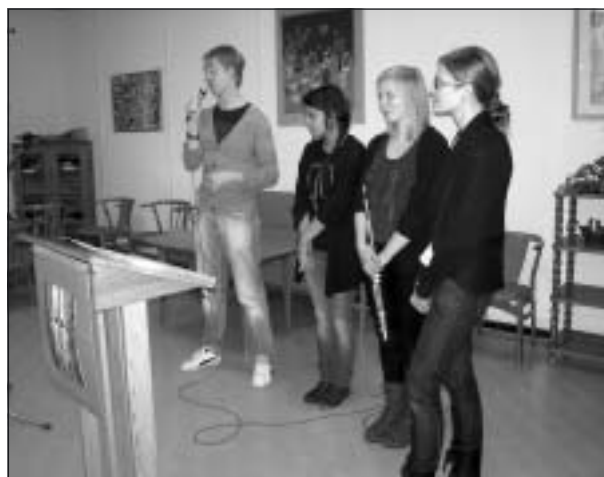
Elever från Kulturskolan sjöng och spelade flöjt.

Alla som vill ha ledsagning till exempel vid tandläkar- eller läkarbesök, teater, bio, shoppingrunda, idrottsevenemang, föreningsaktiviteter, kyrkobesök eller liknande kan höra av sig till Kontaktservice tel. 617 44 två dagar innan. Hjälpen kostar ingenting! Sina egna utgifter får var och en betala.