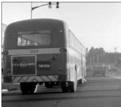
Det var skillnad på "svart" och "vit" buss.