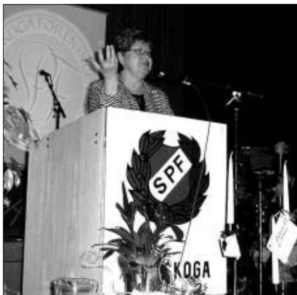
Landshövding Gerd Engman var imponerad över SPF:s verksamhet.

- Jag brukar skämta om att jag numer har klippkort till Karlskoga för att vara med och klippa invigningsband i det fortsatta arbetet med en omdaning och utveckling av nya etableringar som ersättning för den tidigare så dominerande försvarsindustrin.