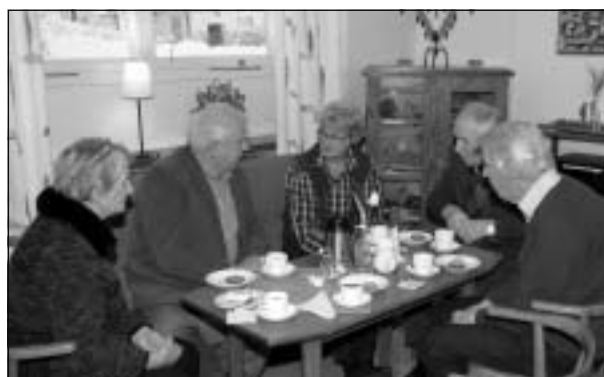
Livlig diskussion vid ett av kaffeborden.

Årsmötet avslutades traditionsenligt med kaffe och lotteridragning i Mariasalen.