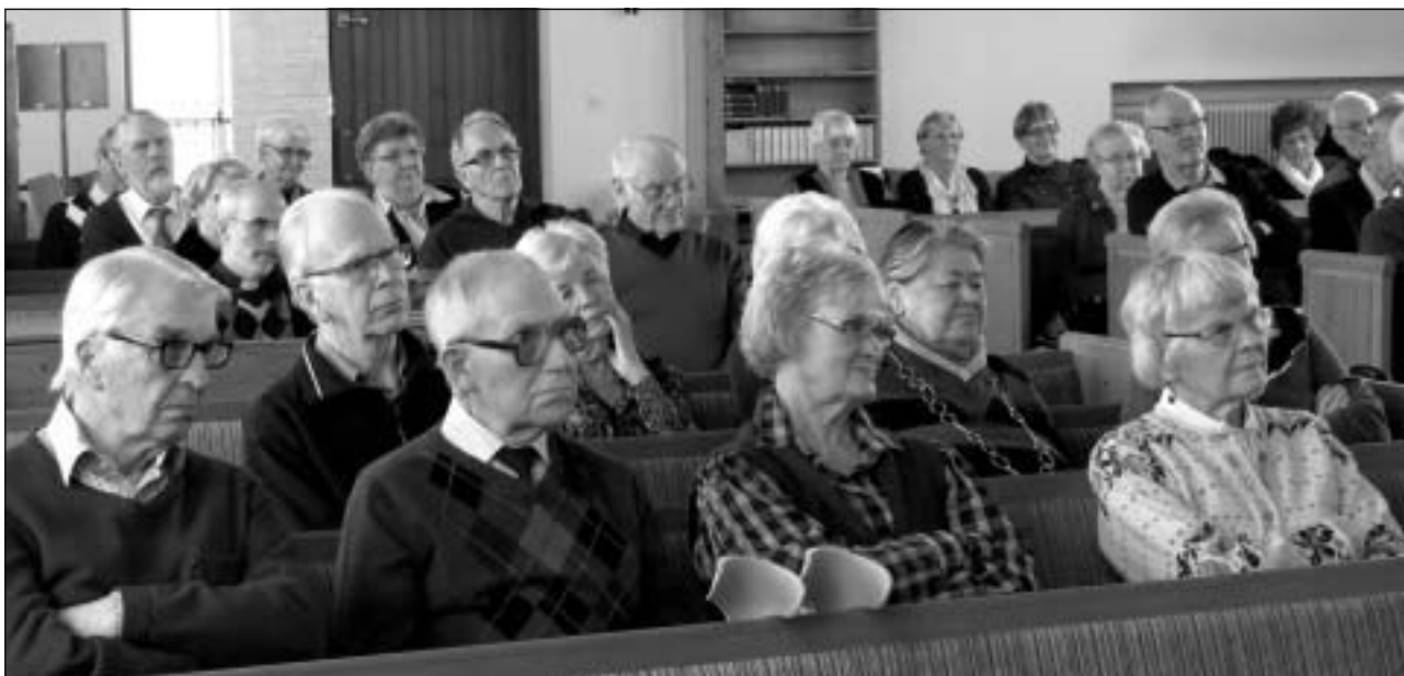
Publiken lyssnar andäktigt under årsmötet.