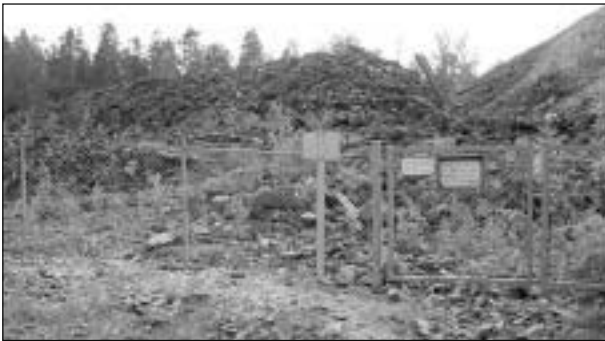
Det inhägnade fridlysta området med varphögar i Långban.

I Värmland började nuvarande berggrund bildas för 2 miljarder år sedan, först genom vulkanism (leptitformationen) och senare genom granitbildning på djupet. Alla malmfyndigheter i Bergslagen är kopplade till leptitformationen.