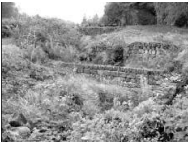
Karlsdal: Resterna av den gamla masugnen (från 1640-talet).

Det var strålande solsken och varmt och skönt när 19 medlemmar samlades till höstutflykt den 3 september.