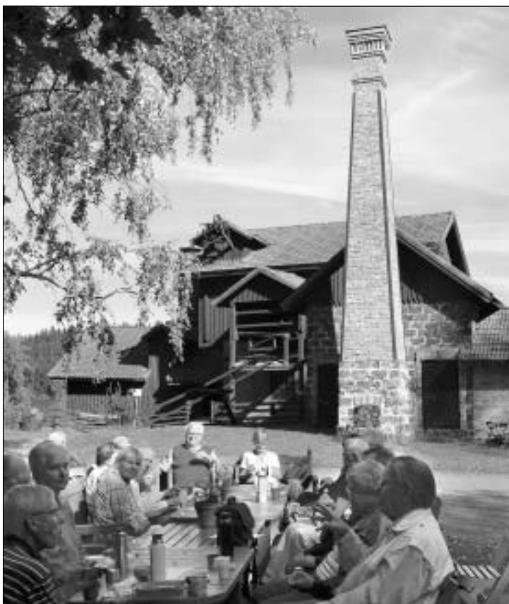
Kaffet smakade bra i Granbergsdal. I bakgrunden ser vi delar av hyttan. Det höga tornet hör till förvärmningsugnen.