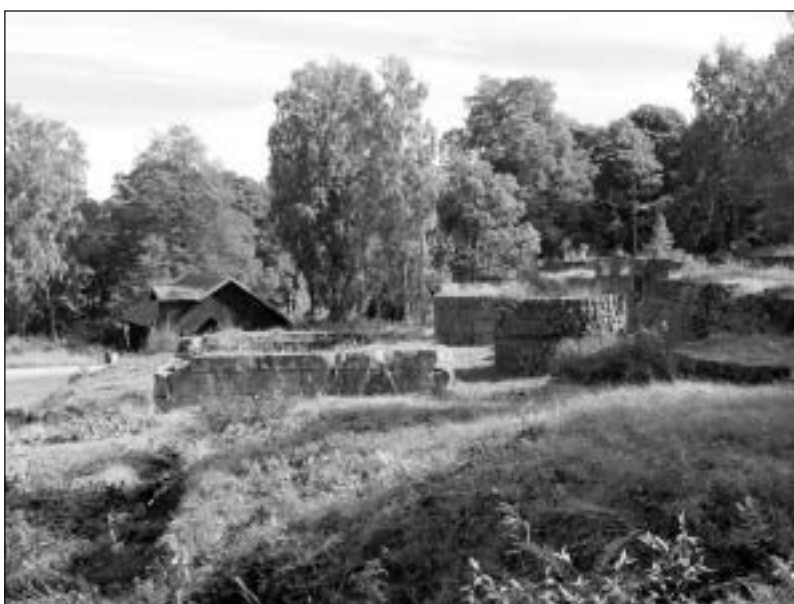
Karlsdal: I bildens mitt ser man resterna av den nya masugnen (från 1874). Till höger syns rester av två runda rostugnar. Byggnaden i bakgrunden är kraftstationen.

Sverige. Den anses ha haft en avgörande betydelse för den framväxande industrialismen.