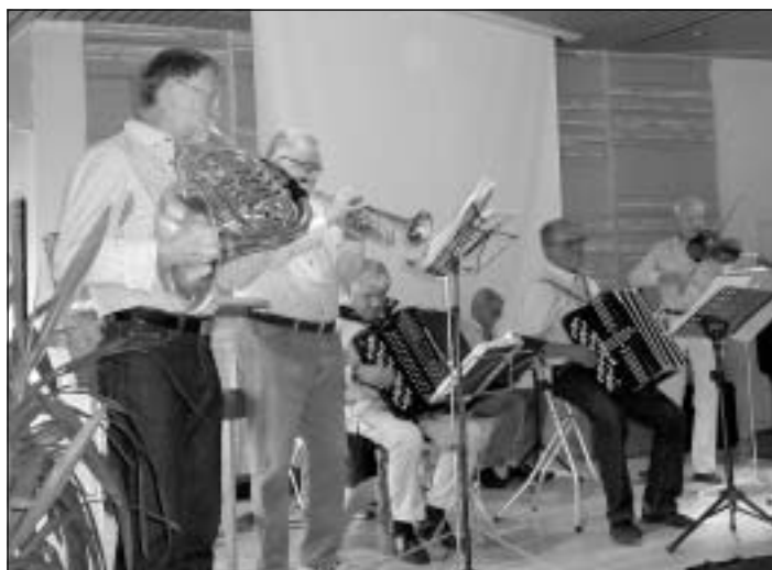
Strömtorparna (basisten tyvärr något skymd).

Valberedningen bör helst bestå av fyra personer, och sådana som har bott länge i Karlskoga och har många kontakter skulle naturligtvis vara extra värdefulla.