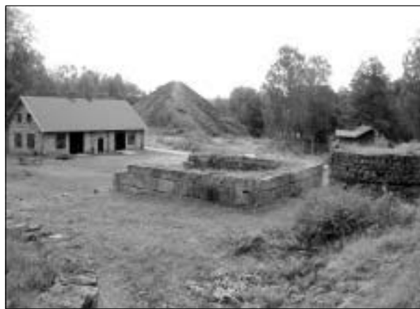
Karlsdal: Den enorma slagghögen är ett påtagligt minne från den omfattande verksamheten. Byggnaden till vänster är smedjan. Till höger syns en rund rostugn och mitt i bilden den nya masugnen.