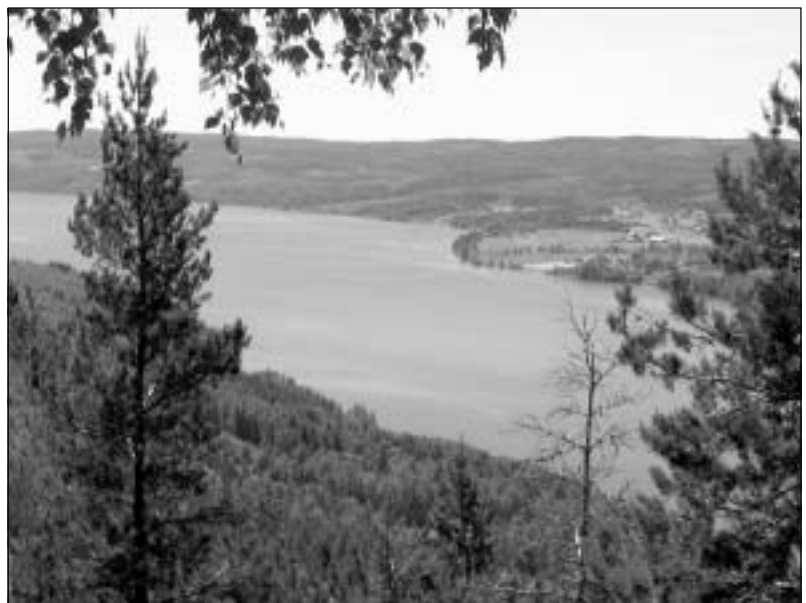
Vy från Gettjärnsklätten åt söder över Rottnen. Mylonitzonen (en deformationszon) utefter västra stranden bildar gränsen mellan mellersta och västra Värmlands berggrund.