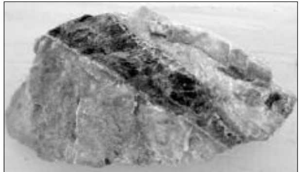
Svart yttriumbaltig allanit insprängd i fältspat från Åskagens pegmatitbrott (naturlig storlek).

Långban ligger i Filipstads kommun och är Sveriges mineralogiska eldorado. Här finns 270 olika mineral och det är flest mineral på jorden på samma yta. Vissa mineral finns bara i Långban. Många innehåller arsenik. Under 1800-talet var Sverige världsledande inom kemin med många framstående vetenskapsmän så Långban blev världsberömt och många från andra länder blev intresserade. Det kom t.o.m. lastbilar från Tyskland som lastade på mängder med sten. Förr kunde man nämligen gå fritt på stenhögarna och