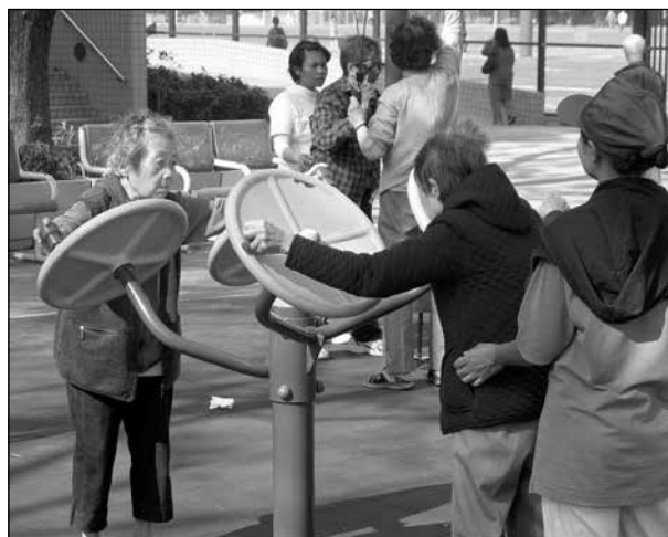
Motion i parken.

I andra parker kunde man se motionsredskap som ofta används av pensionärer. Det kanske vore något att ta efter i vårt land?