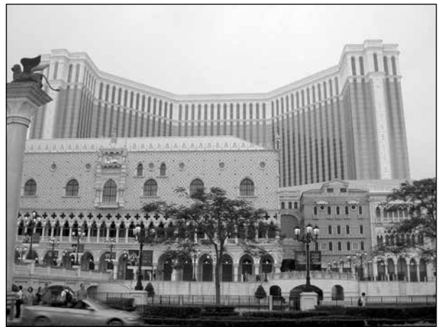
Kasinot Venetian Macau.

En speciell företeelse i Macau är den enorma mängden kasinon. Vi såg många foton på sådana, det ena större och vräkigare än det andra. De omsätter motsvarande 38 miljarder US-dollar per år. Motsvarande belopp i Las Vegas är omkring 1/6 av den summan.