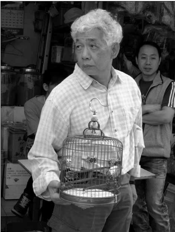
Vanlig syn i fågelparken.

Det finns fantastiska blomstermarknader, fågelmarknad och även en med akvariefiskar. Det var vanligt, speciellt kanske bland äldre män, att man hade en bur med fågel i som man bar med sig. Då kunde man sitta på en bänk och prata med den en stund. På fågelmarknaden kunde man också köpa gräshoppor att mata sin fågel med.