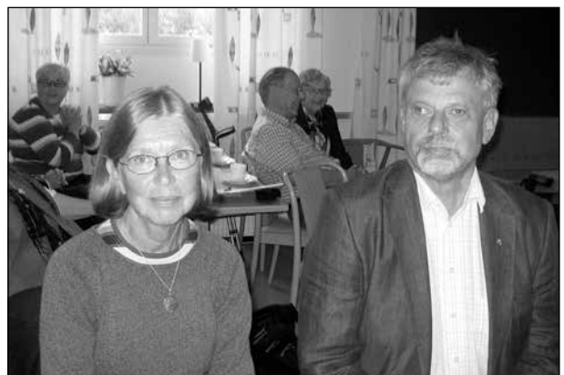
Föredragshållarna pustar ut efter den uppskattade presentationen.

Det var en intressant och omväxlande bildrapso-di vi fick se från miljöer som är totalt olika de vi är vana vid. Föredragshållarna tackades med applåder och blommor.