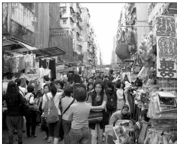
Ladies Market, ett exempel på shopping och folkträngsel.

Guld är populärt, bland annat som present till brudpar. Är det harens år så kan det bli en hare av guld. Om man vill trängas ordentligt ska man gå till kvällsmarknaden vid Temple Street. Vi kunde verkligen se folkträngseln och dessutom bilder som visade att där fanns i stort sett allt.