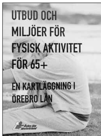
Omslaget till utredning om fysisk aktivitet 65+.