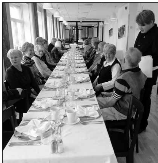
Det här vackert dukade bordet mötte oss vid lunchen förra året.