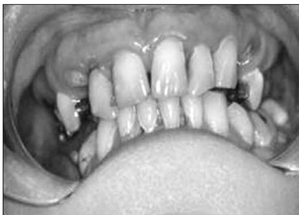
Vid muntorrhet förlorar tänderna salivens skyddande effekt vilket kan bli förödande för bettet.