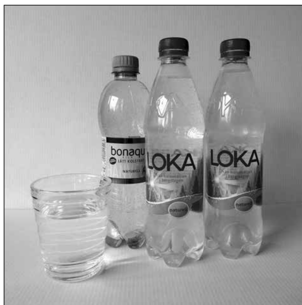
Mellan måltiderna, drick inga sötade drycker, drick bara rent vatten!

Viola beskrev tandraderna som ett staket. När vi borstar tänderna gör vi det på utsidorna, insidorna och översidorna. Vanlig tandborste med litet, mjukt borsthuvud går bra men en elektrisk