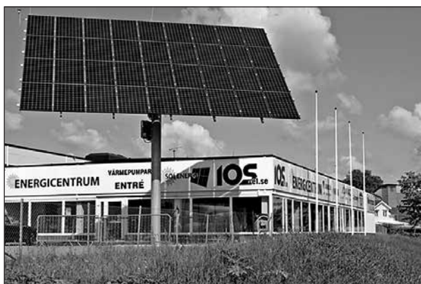
Solföljare installerad vid IOS lokal i Karlskoga.

Att placera solpanelerna på taket är det vanligaste och naturligtvis är det bäst om man har ett tak som sluttar åt söder. Den optimala lutningen på taket är 30-50%.