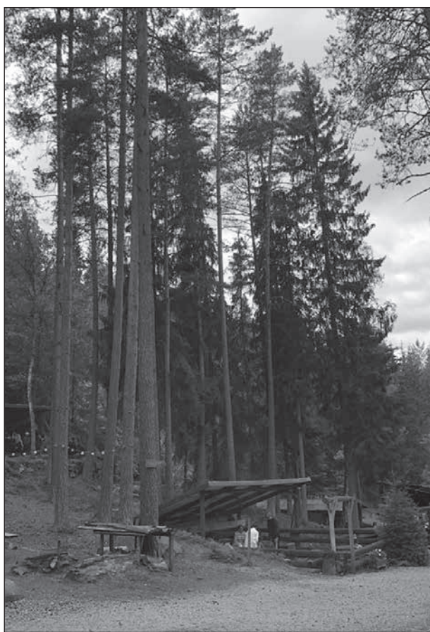
Ingången till gruvan.

Historien om Kleva Gruva började 1691. Då hittade man kopparfyndigheter och aktiviteten i gruvan varierade fram till 1838. Då påvisade Jöns Jakob Berzelius nickelförekomst, som sen blev det huvudsakliga att utvinna. 1920 upphörde brytningen.