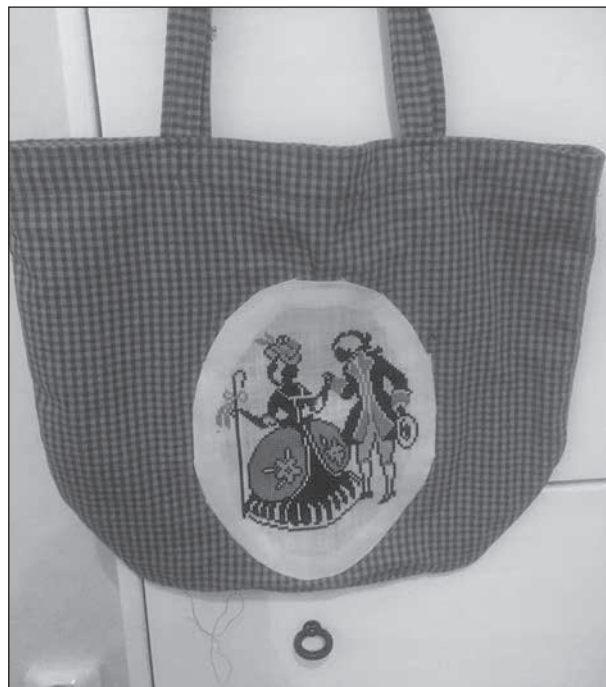
Signes tavla av okänt ursprung fick nytt liv på en kasse.

Vem var Signe, som broderat detta? Var hon en herrgårdsfröken, som drömde sig tillbaka till 1700-talet? Var hon en bondhustru, som ville pryda salsväggen med något vackert?