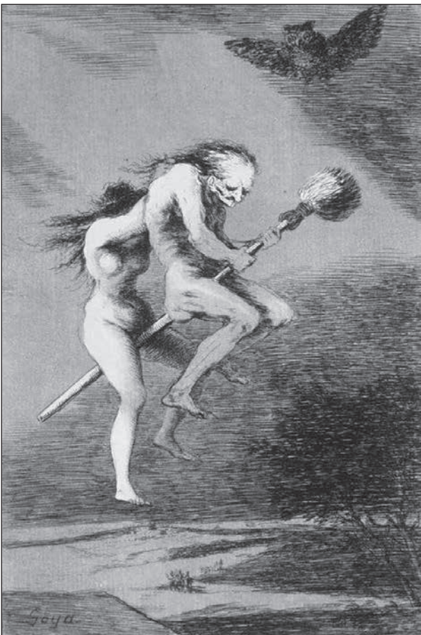
Sorgligt nog var detta en "verklighet" som man trodde på. Och vi vet hur det kunde gå om man blev utpekad som häxa.

Påskan idag är en familjehögtid där gammal folktro och fornnordiska traditioner blandats med kristna traditioner. Redan i mitten av 1800-talet vet man att barn klädde ut sig till påskkärringar, men det började tidigare, kanske innan seklets början.