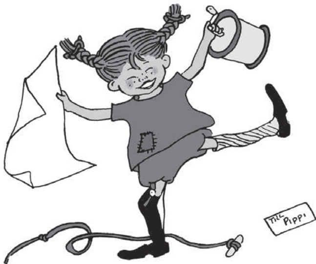
Vår mest berömda sakletare.

Pippi Långstrump påstod sig vara en sakletare. Hon hade förmågan att se både värdet och det vackra i sådant som andra kastat bort. Jag känner mig också som en sakletare, som försöker hitta udda ting som kan återbrukas.