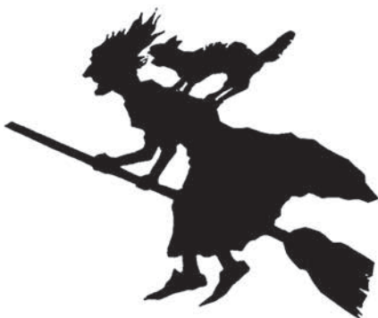
Påskkärring utan kaffepanna. Kaffet kom till Sverige ca 100 år senare än påskkärringarna.

Påskharen tror man finns genom att man helt enkelt sett fel på gamla illustrationer av det bibliska påskalammet och tolkat det som en hare. Traditionen med påskharen som kommer med påskägg till barnen, är tysk och har anor från 1600-talet. På