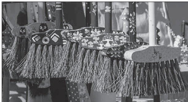
Men en fin kvast måste hon förstås ha.

1850-talet lanserades påskharen med påskäggen mer allmänt av tyska godis- och leksakstillverkare. Påskharen kom till vårt land under 1900-talet, men i Sverige är det kycklingar och ägg som hör till påsken bl.a. i form av påskkort.