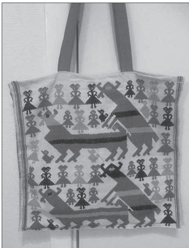
Den märkliga väven blev en kasse som fått namnet "Cerise påsättning".

En kvinna berättade att hennes farfar hade arbetat i Peru på 1930-talet och haft med sig dukar och kuddfodral hem, där motiven liknade det på väven. De stora djuren skulle vara alpackor eller lamor. Tipset var också att göra en bildsökning, men den gav ingen ny ledtråd. Vävnader eller applikationer från Peru föreställer ofta alpackor, men kvinnorna har hattar eller slätborstat hår. Rastaffätor lyser med sin frånvaro.