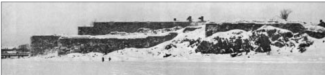
Sveaborg i vinterskrud, en gång "Nordens Gibraltar".