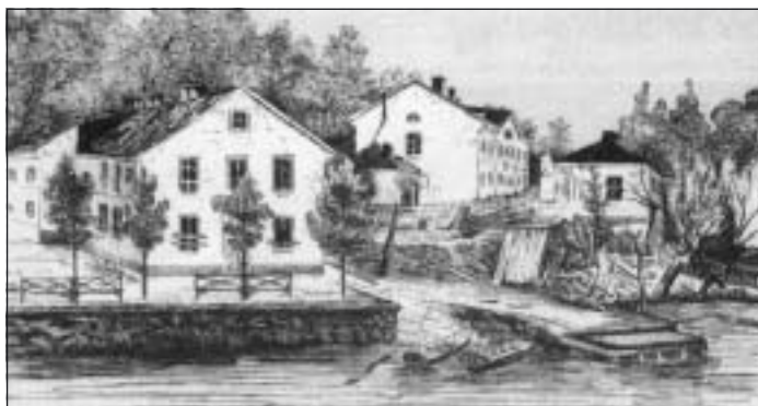
Heleneborg kort efter explosionen den 3 september.

ningen” och menade att minorna ”måste vara ett af de på en gång billigaste och förträffligaste medel för Sveriges inre sjö- och kustförsvar” och man gjorde också demonstrationer, ”profförsök”, med minorna för att få dåvarande sjöministern intresserad.