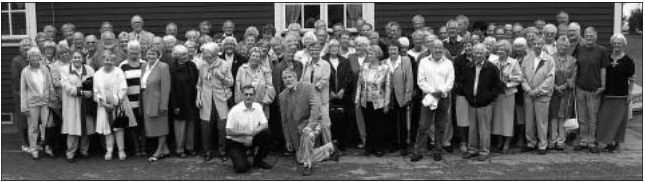
Merparten av SPF:s alla funktionärer samlade vid Labbsand.