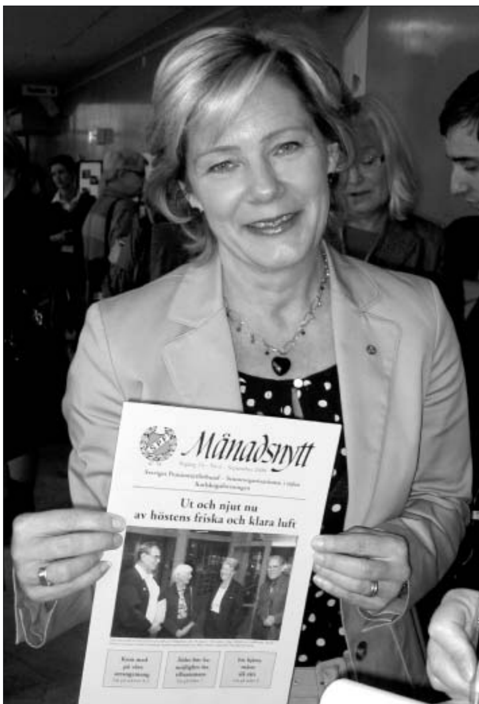
Äldre- och folkhälsominister Maria Larsson presenterades för Månadsnytt och höll en uppskattad föreläsning på Folkhälsodagen i Karlskoga den 8 oktober. Läs mer på sidorna 8-9.

Sveriges Pensionärsförbund – Seniororganisationen i tiden Karlskogaföreningen