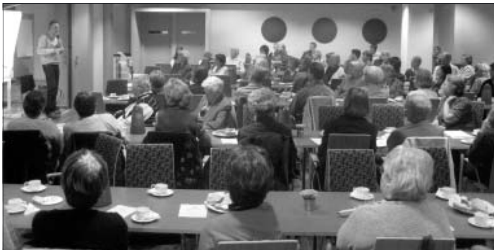
Intresserade åhörare under Anhörigdagen.