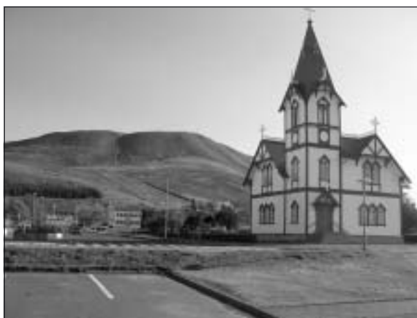
Húsavík: kyrkan och stadsberget.