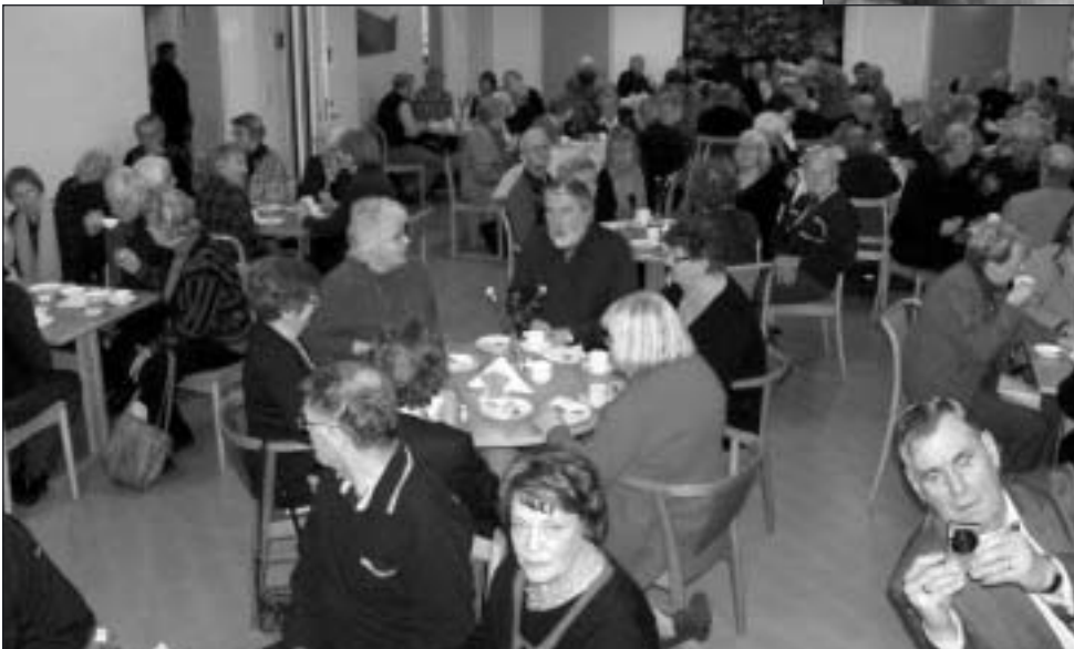
Stämningen var god efter väl avslutat årsmöte.

Text: Bengt Aldén