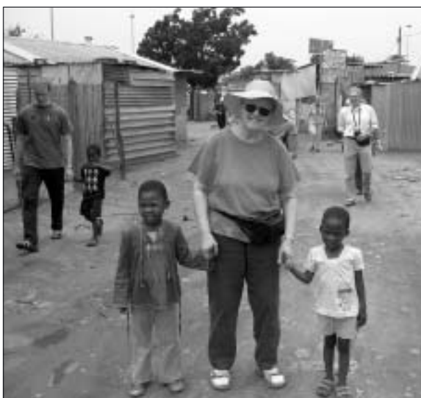
Artikelförfattarinnan tillsammans med ett par småflickor i kåkstaden.

Vi gick till kåkstaden tillsammans med en ung man vid namn Lebo, som bodde i närheten och med sin fru drev en liten restaurang med övernatt-