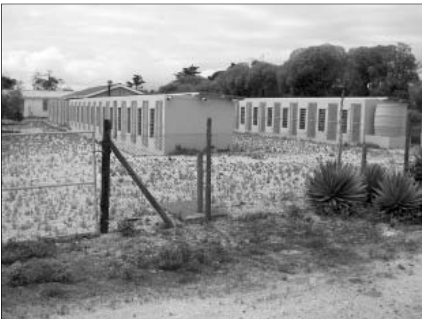
Exteriörbild från fångellet.

I allmänhet var brottsrubriceringen sabotage, och för det behövdes inte mer än att leda en grupp protesterande studenter.