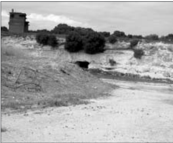
Kalkbrottet, där många fick hälsan förstörd.

Bland annat såg vi det omtalade kalkbrottet, där fångarna tvingades arbeta hela dagarna. Det enda skyddet mot den obarmhertiga hettan var en grotta där man kunde ta skydd när man hade matrast. Både ögon och lungor tog ofta skada av solljus och kalkdamm.