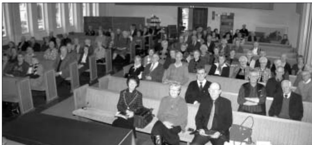
Merparten av deltagarna i årsmötet församlade i kyrksalen.