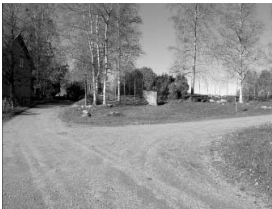
Så ser det fortfarande ut "bort i vägen".