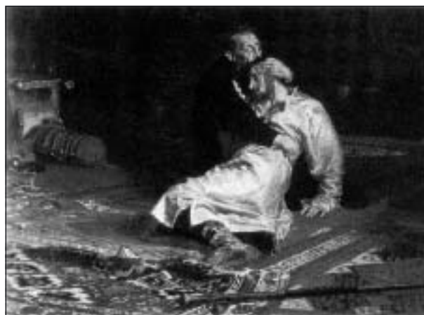
Ilja Repins dramatiska historiemålning.

Så småningom kom dock hela statsapparaten i