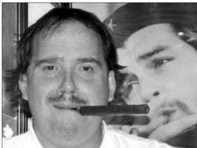
Något som Kuba är mest känt för är väl sin tobaksodling och cigarrtillverkning. Cigarrtillverkningen är ett rent hantverk. I stora salar i de numera statliga fabrikerna arbetar man vid bord i långa rader. Det är en svår konst att rulla en cigarr – en skicklig arbetare kan göra 30-40 i timmen. Ingen cigarr är den andra riktigt lik till färg och form. Efter en fascinerande sortering ligger dock precis likadana cigarrer i varje låda.