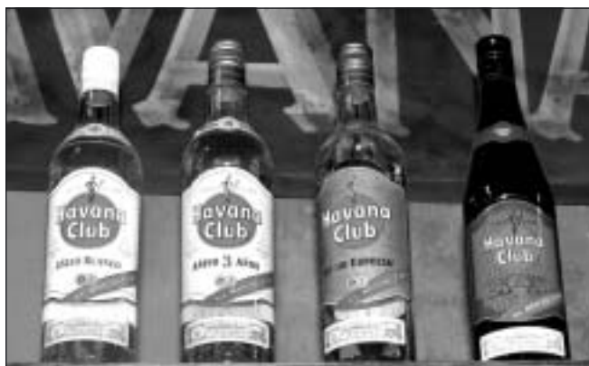
Den kubanska rommen är något av en nationaldryck. Den finns i många kvalitéer, ljus och mörk och av olika ålder. Den tillverkas som whisky, men på sockerrörsextrakt i stället för malt. Priset varierar från ca 30 kronor per 75-a upp till flera hundra för de bästa kvaliteterna som då är 15-20 år gamla.