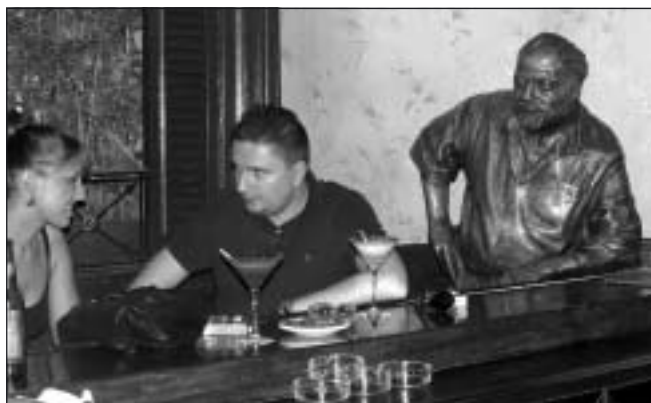
Författaren och Nobelpristagaren Ernest Hemingway bodde flera år i Havanna. I baren på puben Floridita sitter han numera på sin favoritplats – som bronsstaty. Här i sällskap med en yngre avbild i samma pose.