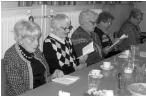
Glada sångare på kafferepet.

Torsdag varannan vecka klockan två är det kafferep på Träffen. Kaffebordet är dukat och man bänkar sig för en trevlig stund.