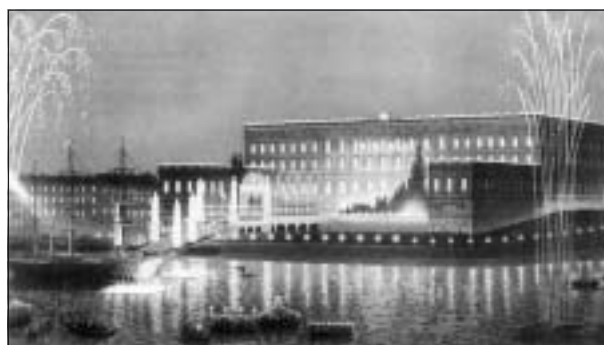
Vegafestligheterna på Strömmen 24 april 1880.

Den aprilhändelse som detta nummer knyter an till är de s.k. Vegafesterna i april år 1880. De startade i Stockholm kvällen den 24:e, när de länge efterlängta gästerna dök upp. De kom sjövägen