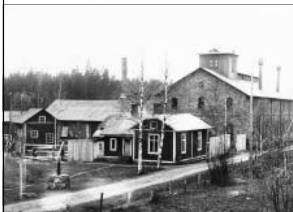
Stålverket i Öfalla med Sveriges första elektriska ugn.