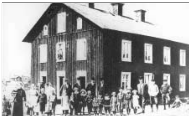
Brödlösa arbetarbostäder. Vy från Rävåsen.