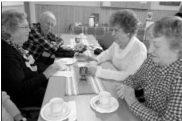
Samvaro vid kaffebordet.