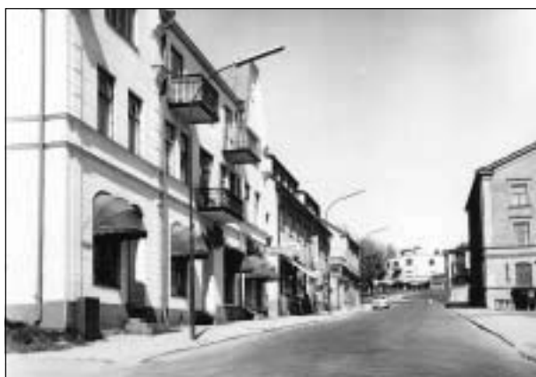
Stationsgatan med Reinholds konditori 1973.