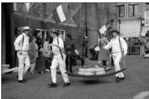
Ostmarknaden i Alkmaar, invägningen har gått till på samma sätt sen 1600-talet.

Belgien har, trots sin ringa yta, en nationalpark men också annat att bjuda på. Men man ser också överallt spår efter förstörelsen i naturen från alla granater under första världskriget. På de flesta stäl-