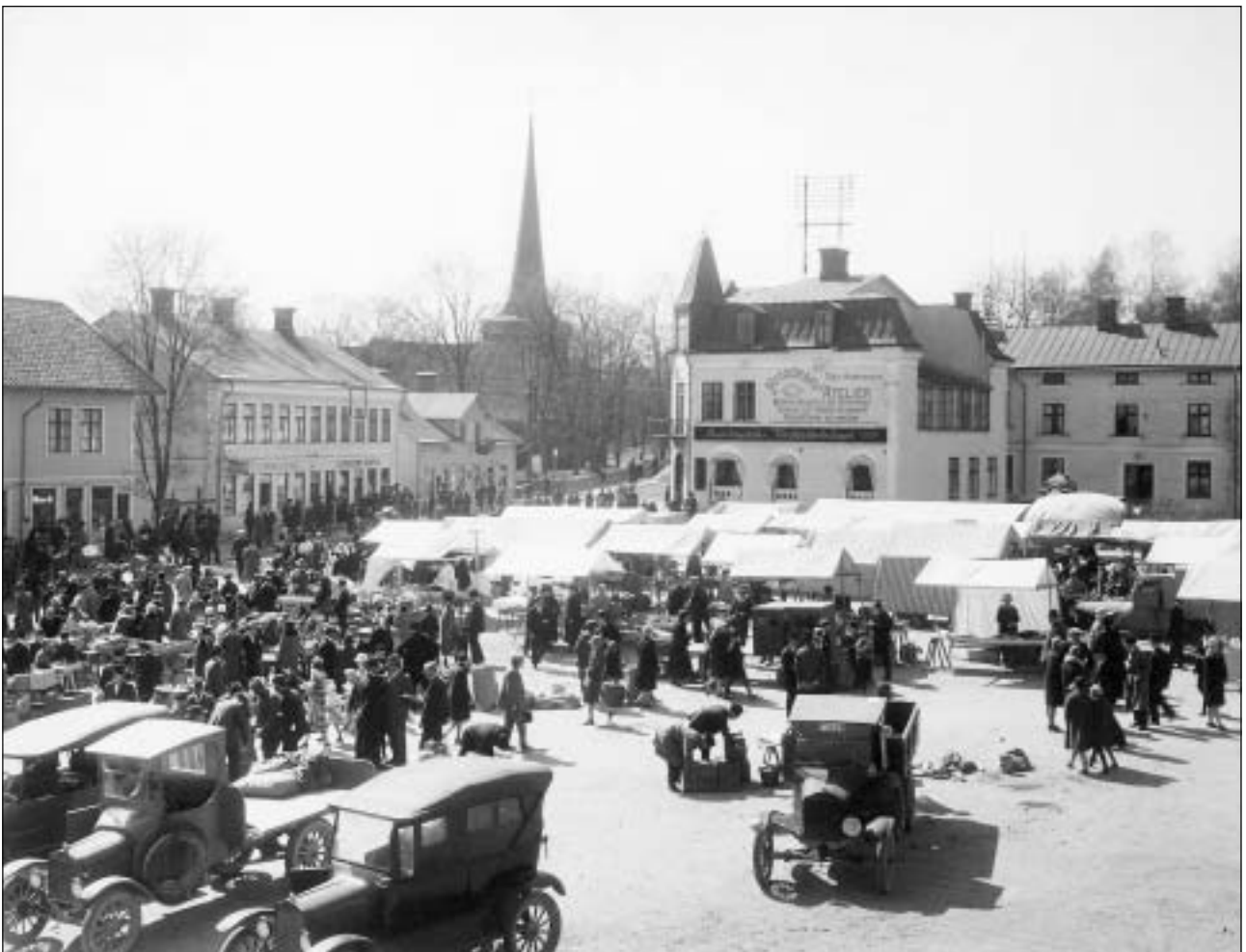
Torget i Karlskoga för 100 år sedan. Se flera gamla bilder från Karlskoga på sidan 9.

Sveriges Pensionärsförbund – Seniororganisationen i tiden Karlskogaföreningen