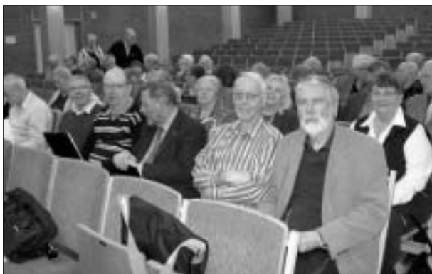
Karlskogagänget bänkade inför årsstämman.

Den 11 april avhölls Örebro distriktets årsstämma på Lindeskolan i Lindesberg.