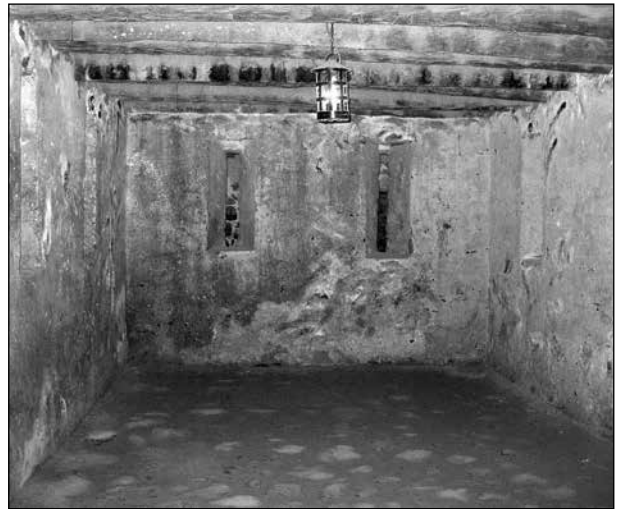
Här placerades 20 – 30 personer.

Det är knappast möjligt att ens föreställa sig hur förhållandena var. Omänskliga är ingen överdrift. En cell på omkring 8 m 2 kunde rymma ca 20 - 30 personer som satt fastkedjade.