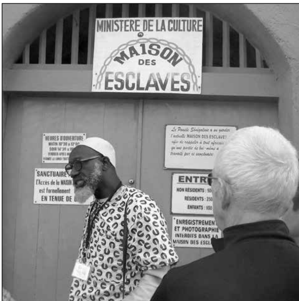
Vår guide på väg in i slavhuset.

Numera tvivlar en del på att Goree Island spelade en fullt så avgörande roll i den hemska hanteringen. Men det är något för forskare att diskutera, för det viktiga är att vi får en inblick i hur man bar sig åt.