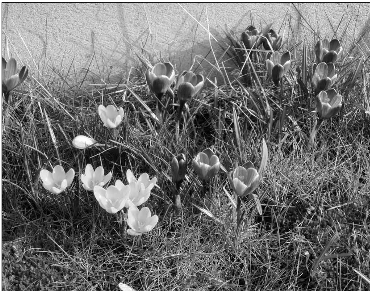
Krokusen började blomma tidigt i år.

Sveriges Pensionärsförbund – Seniororganisationen i tiden Karlskogaföreningen